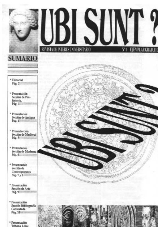
Portada de la revista Ubi Sunt? n o 1, a finales de 1997

Los primeros años bien se podían destacar por mostrar entre sus páginas unos artículos que se tenían que ceñir al poco espacio disponible 5 o el hecho de que la inmensa mayoría de los escritos lo realizaran alumnos de primer y segundo curso de la licenciatura. Esto explica que las primeras revistas fueran de carácter divulgativo, aunque dicho