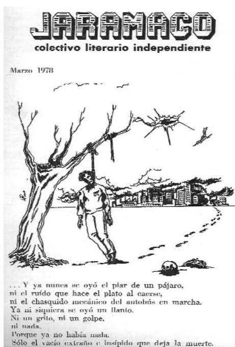
Portada de la publicación Jaramago nº5, marzo de 1978.

Cuando estas líneas se publiquen, amable lector, esperamos que entre nuestras manos podamos tener la Revista de Historia Ubi Sunt? número 20. No será la única cifra redonda que rodeará a la Asociación gaditana por estas fechas. En 2007 se cumple el décimo aniversario de la publicación, es posiblemente el momento de mirar atrás y reflexionar, no ya sólo sobre dicho modelo de asociacionismo universitario, sino además, intentaremos llegar un poco más allá y arrojar un poco de luz sobre esa otra Historia de la Universidad de Cádiz, la que como ocurre en los grandes manuales de Historia, no aparece en los aniversarios institucionales: hablamos del movimiento estudiantil y universitario. Entendemos este escrito como un primer paso, así sentimos las posibles ausencias u omisiones ajenas a nuestra voluntad.