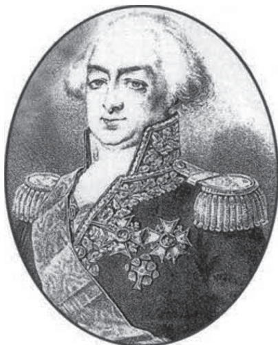
Fig. 1: Vicealmirante François-Etienne de Rosily.

Sin embargo, antes de entrar a describir los sucesos que acontecieron a mediados de junio de 1808 en el sur de la Península Ibérica, es necesario realizar un pequeño encuadre histórico de la situación que se estaba viviendo en España en general y en Cádiz en particular.