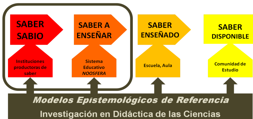
Figura 1. La posición del investigador en la TAD. Adaptado de Bosch y Gascón (2009)

Rastreademos la presencia del metaconcepto biodiversidad (Armúa de Reyes, Guirardo y Brataszczuk, 2005; Vázquez-Ben y Bugallo-Rodríguez, 2018) en las leyes educativas desde 1990 hasta la actualidad (LOGSE, LOE y LOMCE) en la Etapa de Primaria, puesto que indica su relevancia social. Se comparará el nivel ministerial con el nivel autonómico andaluz. Para ello realizaremos un análisis cualitativo y cuantitativo de su presencia en dichas leyes, la rigurosidad con que es presentada, cómo se plantean y articula los distintos niveles que la conforman. Nuestra hipótesis es que el tratamiento de la biodiversidad en el primer escalón transpositivo es pobre, y que esta no se representa suficientemente en nuestras leyes educativas.