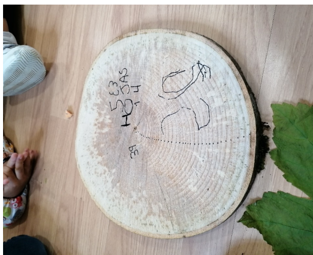
Figura 2. Rodaja cortada de un tronco de cerezo, tras su empleo en la actividad (elaboración propia)

Tras escuchar la lectura mencionada en la actividad anterior, se procede a mostrar cómo es posible conocer la edad de un árbol. Para ello, se han llevado al aula dos troncos de cerezo de diferentes tamaños. Lo primero, ha sido analizarlos, observar cómo era su forma, tamaño, peso, color, corteza, etcétera. Luego, se ha dejado que el alumnado contara sus propias teorías acerca de los años. Tras esto y con la ayuda de un rotulador se han ido señalando uno a uno los anillos para conocer su total y con ello los años (Figura 2). Relacionar las características del árbol visibles en el tronco y su sección, así como explorar habilidades matemáticas como el conteo y las magnitudes han estado presentes en la actividad. El propio alumnado ha realizado el conteo de los distintos anillos (consultando dudas con la maestra), escrito su número sobre la rodaja y reflexionado sobre ello. El plantear diferencias con troncos de otras especies facilita la comparación e identificación de los árboles. Se ha aprovechado también para trabajar la lectoescritura al escribir sobre él “hoja”, “madera”, etcétera. Se ha buscado una participación del alumnado acorde a sus capacidades.