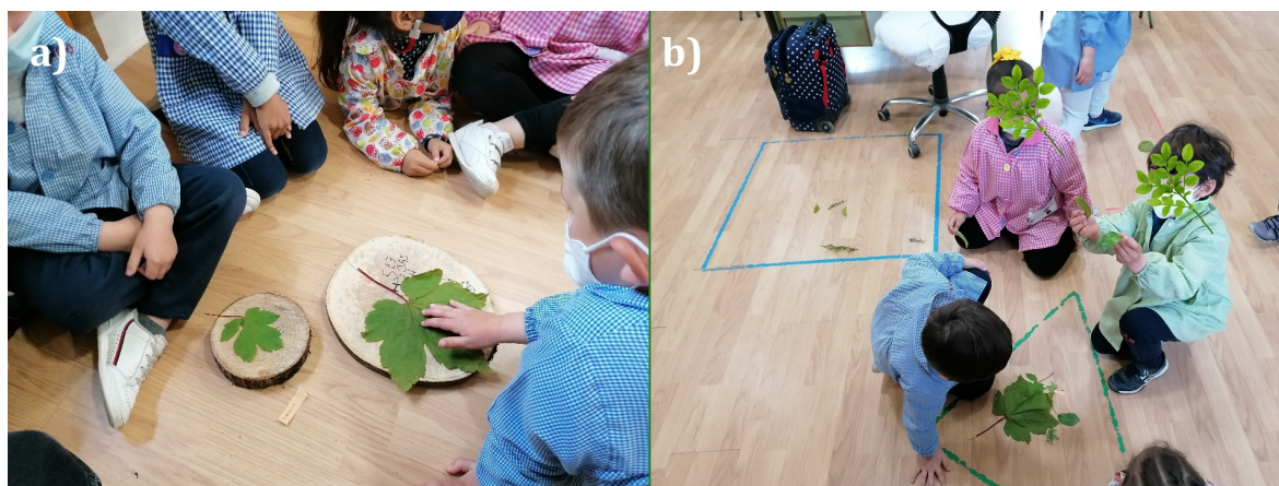
Figura 3. Ejemplo de actividades desarrolladas sobre las características de las hojas: a) comparando las características de dos hojas de la misma especie; b) analizando y clasificando las hojas (elaboración propia)

Tras haberlas comentado todas, las contarán para saber cuántas hay, las ordenarán por tamaños, las agruparán por similitudes, por colores, por formas, etcétera. Compararán las características de las hojas de la misma especie entre sí, destacando los parecidos y diferencias entre ellas, y las de distintas especies (Figura 3). Y, para finalizar, saldrán entorno de la escuela a recoger algunas hojas y compararlas luego con las ya existentes o conocer otras nuevas (hiedra, hortensia, arce y aguacate).