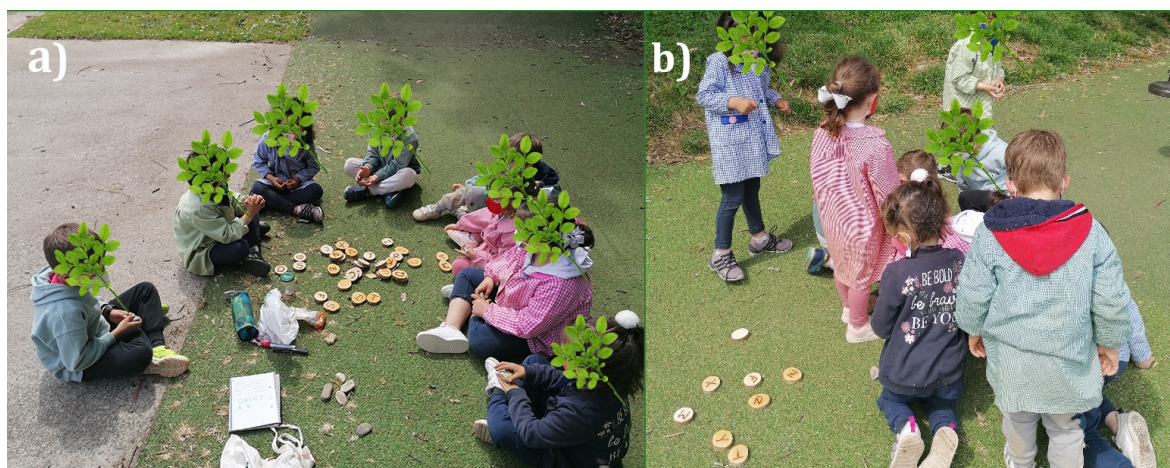
Figura 4. Ejemplo de actividades de acercamiento a la lectoescritura en madera: a) toma de contacto con las letras en madera; b) buscando las letras por el patio (elaboración propia)

Terminado esto, procederán a la formación de sílabas sencillas, unas veces indicadas por la maestra y otras será el propio alumnado el que decida qué sílaba formar. Por último, se les pedirá que formen un círculo y se les asignará una o varias letras a cada estudiante. Según se les vaya indicando, deberán ir saltando de un círculo de madera a otro para formar una palabra o sílaba (dependiendo del nivel), bien sugerida por la maestra o bien desde su iniciativa.