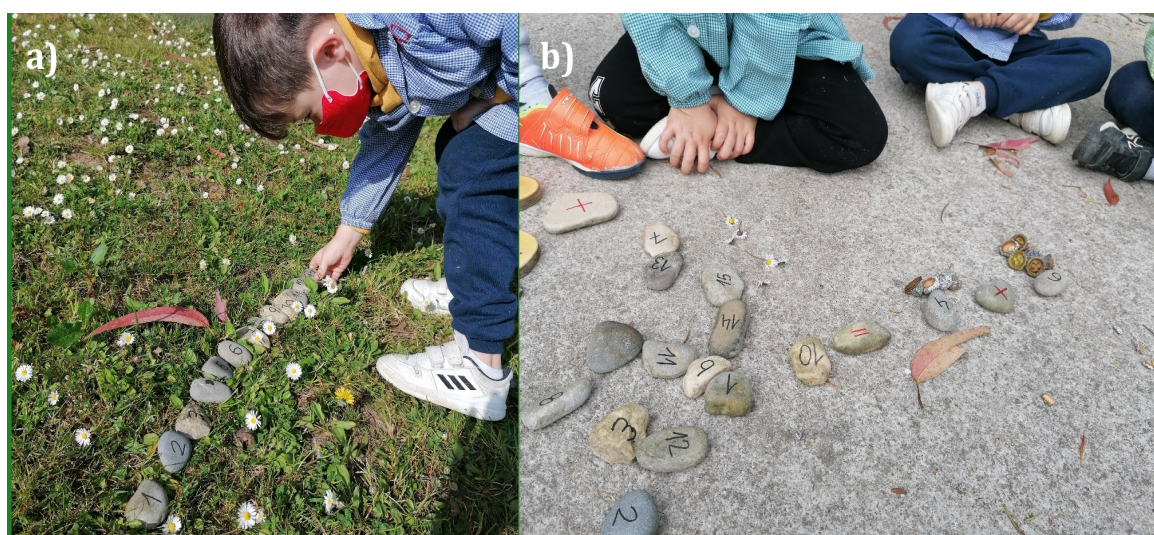
Figura 5. Ejemplo de actividades de acercamiento a las matemáticas con elementos naturales: a) colocando los números en sentido ascendente; b) realizando sumas sencillas (elaboración propia)

Vinculada a la actividad anterior, la segunda actividad de matemáticas en piedra consiste en asignar a cada estudiante un número que le indicará la cantidad de elementos naturales (bellotas de roble, frutos de eucaliptos, flores u hojas) que debe recoger. Cuando lo hayan hecho, lo pondrán en común y de manera conjunta comprobarán que el número de objetos recogidos se corresponde al número otorgado. A continuación, utilizarán dichos elementos para apoyarse en la realización de sumas y restas. Es decir, si le corresponde operar: “6+4”, deberá colocar por un lado seis elementos y por el otro cuatro, contándolos todos al final para obtener así el resultado (Figura 5). Es un método de enseñanza de las matemáticas que les motiva y que realizan como si de un juego se tratara.