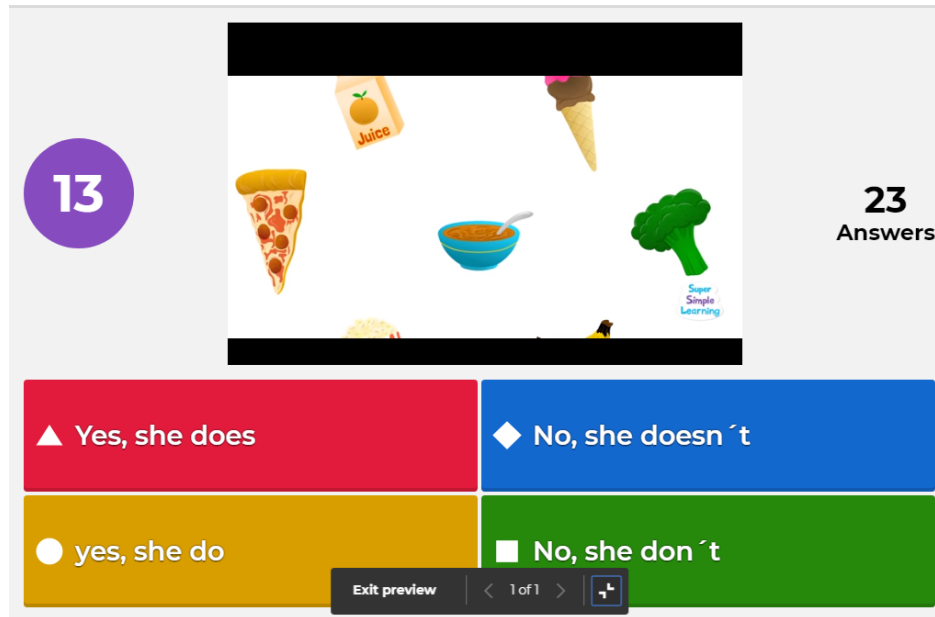
Imagen 2. Pregunta de comprensión auditiva y corrección gramatical en Kahoot.

Durante todo el proceso se incentivó el uso no solo de las TICs sino de las TACs, es decir, un uso pedagógico de las tecnologías, lo cual potencia el aprendizaje (Velasco Rodríguez, 2017).