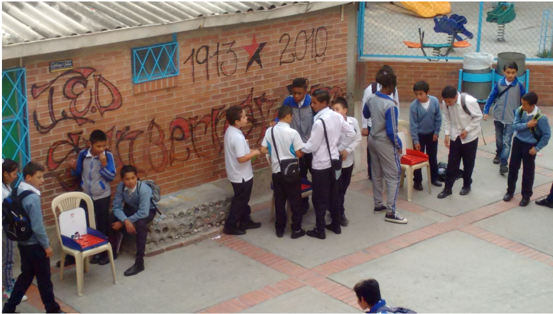
Figura 4. Casita de la paz. El proyecto surge como alternativa de actividades lúdicas durante los tiempos de descanso, con el fin de atenuar los conflictos surgidos en el patio durante improvisadas disputas de balones. Cada estudiante acude a la casita para solicitar juegos didácticos, canchas de mini-tejo y juegos de mesa.

Proyecto “y Vos-qué?”: Espacio de comunicación abierto para los estudiantes que están consumiendo o en riesgo de consumir sustancias psicoactivas. Fue abierto ante la negligencia de las instituciones de salud de brindar posibilidades reales de manejo del consumo a los adolescentes. Se ha convertido en un lugar donde es posible la escucha respetuosa de problemas y otras diversas situaciones familiares, así como también de la posibilidad de entender mejor las consecuencias del consumo de estas sustancias. La iniciativa ha logrado apoyar estudiantes en situaciones de consumo de sustancias psicoactivas, abrir las posibilidades de diálogo sin juzgar sus decisiones y posibilitar que puedan hablar abiertamente de lo que son y piensan.