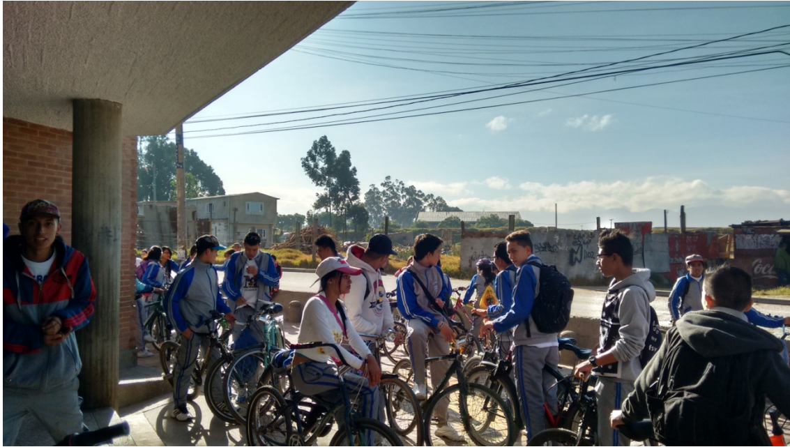
Figura 3. Biciclase. Momentos previos al inicio de recorrido en bicicleta por sitios de interés pedagógico. Cada estudiante lleva su bicicleta, aunque el colegio gradualmente ha ido adquiriendo algunas bicis para uso exclusivo del proyecto. La iniciativa incluye la realización de triciclases, donde niñas y niños de ciclo inicial acuden con sus triciclos, en compañía de papás, mamás y docentes.

Casita de la Paz: Tiene como objetivo propiciar otros espacios de recreación para niñas y niños a la hora del descanso, pues el colegio no cuenta con espacios recreativos suficientes. Del mismo modo busca evitar las agresiones físicas precisamente por la falta de espacio. Los niños y las niñas han vuelto a pensar en juegos antiguos donde pueden encontrar otras formas de divertirse sin el continuo correr o jugar con balones como única opción de divertimento.