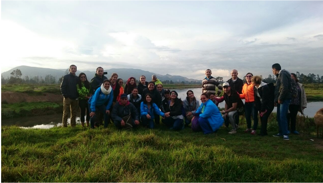
Figura 1. Seinijsuca. Docentes realizando recorrido territorial por el sector Las Juntas: confluencia de los ríos Tunjuelito y Bogotá, territorio muisca de Bosa. Cada seinijsuca consiste en caminar o rodar en bicicleta hacia algún sitio emblemático, procurando establecer diálogos con personas lugareñas para compartir saberes diversos pero comunes. Fuente: Acervo fotográfico comunitario del colegio, octubre de 2017.

Así surgieron ejercicios de pensamiento, estudio, descubrimiento, objetivación y subjetivación en un corazonamiento (sentipensar, corazonar: razón, sentir, hacer) de historias confluyentes en Bogotá como territorio grande, pero en San Bernardino, la vereda donde queda el colegio, como casa de la familia Sanberno -Ver por ejemplo la noción urá-istanakr/urá-wajitró desde cosmovisión u'wa para denotar la reflexión desde el corazón, la evaluación desde sentir-pensar (Panqueba, 2015):- uk'ux b'anobäl si corazonamos pensamiento en maya kaqchikel chabäl . El territorio muisca de Bosa es por tradición acogedor de las diversidades; presenta un matiz inverso al común, pues a Bosa han estado llegando gentes de otras procedencias. Allí han confluído gentes de ciudades, campos, veredas, pueblos, ríos y mares, quienes traen historias de violencia, desalojo y despojo. Pero también llegan con sus riquezas sociales y culturales. Se encuentran en un territorio históricamente azotado por el vandalismo colonial. Pero también es un territorio en el cual justamente se tejieron relaciones interculturales desde hace muchos años.