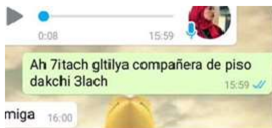
Figura 1. Ah 7itach gtiliya compañera de piso dakchi 3lach (Ah porque me comentaste que fue la compañera de piso y por eso)

El análisis de los datos nos muestra que las prácticas translingüísticas dariya / español/ gallego/ francés son bastante frecuentes entre estos jóvenes e incluso reconocen que es habitual que usen entre ellos lo que denominan «el mezclado», una variedad de translanguaging español de Galicia, gallego / dariya y a veces francés como se ilustra en los siguientes ejemplos obtenidos del chat. Estos dos episodios muestran lo que podríamos considerar translanguaging moments (Wei, 2018). En primer lugar, el aribizi , sistema de escritura alternativo que utiliza el alfabeto latino para representar el árabe y el dariya , es el código de escritura diferente como se refleja en estos ejemplos: