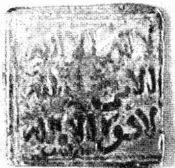
Anverso de dirham almohade; abajo, a la izquierda, posible epígrafe de Arcos (Museo Arqueológico y Etnológico de Córdoba)