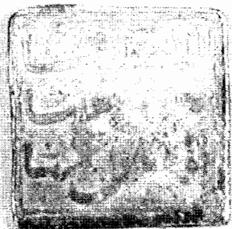
Reverso, muy afectado por concreciones, del mismo dirham acaso acuñado en Arcos.