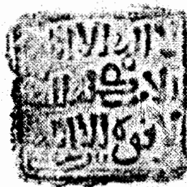
Grafía de Cádiz en el dirham anterior.