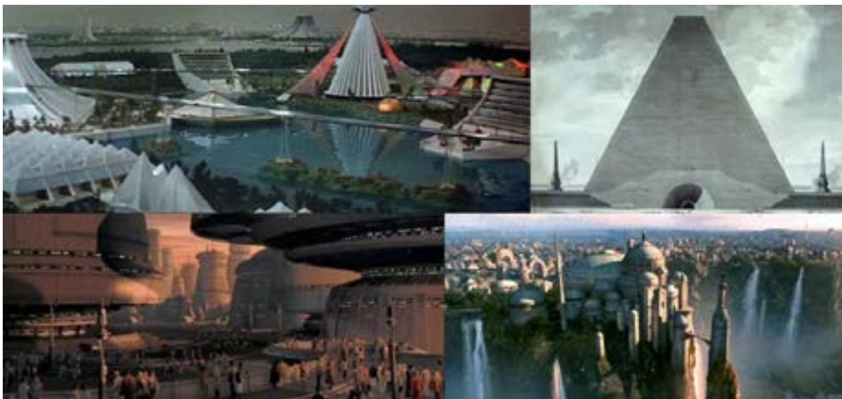
Figura 1. Vistas comparativas de Logan's Run y los Cenotafios de Etienne Boullé (arriba) y los planetas-ciudad de la mitología de Star Wars (abajo)

Fuente: http://cort.as/Z_2X ; http://cort.as/Z_2b