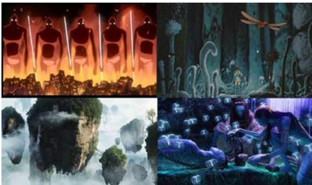
Figura 3. Vistas de Nausicaä de Hayao Minazaki (arriba) y Avatar de James Cameron (abajo)