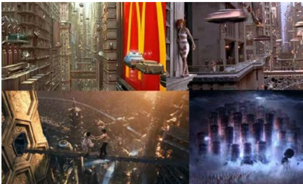
Figura 4. Vistas de El quinto elemento de Luc Besson (arriba) y Cloud Atlas y Matrix (abajo)