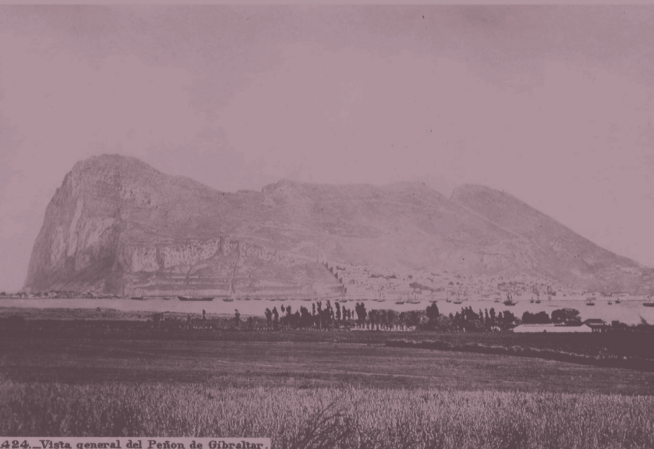
424._Vista general del Peñon de Gibraltar.

Revista Académica sobre la Controversia de Gibraltar Academic Journal about the Gibraltar Dispute