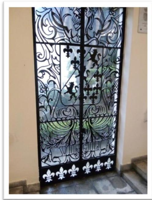
Figura 8. Fotografía de una puerta con el escudo de armas.