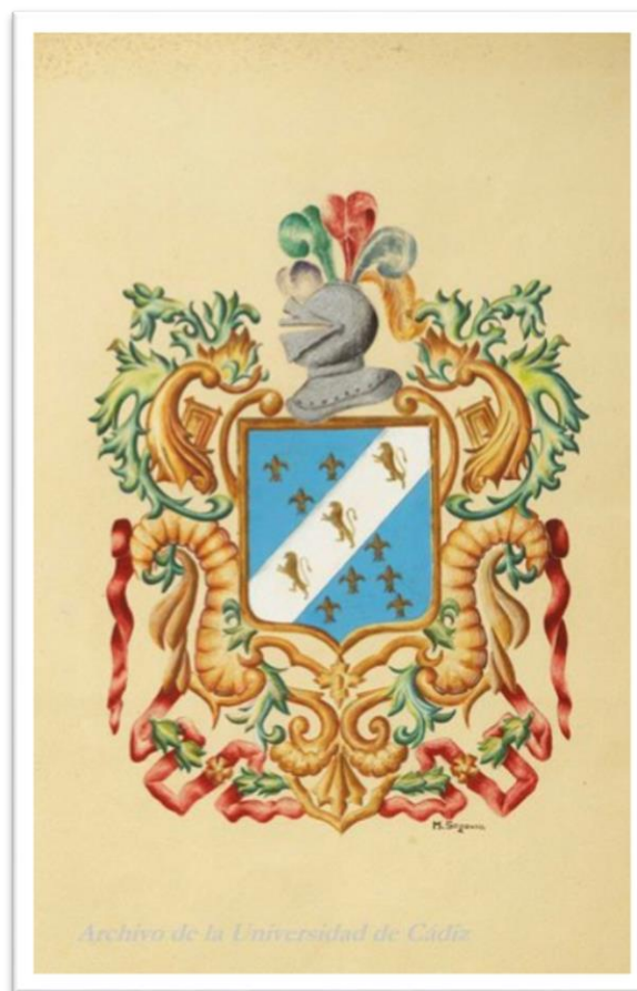
Figura 2. Títulos de Nobleza concedidos a Don Pedro Virgili por S.M Católica Don Fernando VI, 1754-1756

Fuente: Archivo de la Universidad de Cádiz (AUCA). L-61 RC