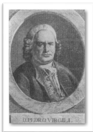
Figura 1. Retrato de Pedro Virgili

Lacomba), fundó el Real Colegio de Cirugía de la Armada de Cádiz 2 . En este centro de formación de la Armada se formaron prestigiosas figuras de la Sanidad Española de los siglos XVIII y XIX 3 . Desempeñó los cargos de Cirujano Mayor de la Armada y Médico de la Real Cámara. Fue también el creador del Real Colegio de Cirugía de Barcelona en 1760, ciudad donde tuvo lugar su óbito en 1776 4 . Remitimos al excelente estudio publicado por el Dr. José Manuel Blanco-Villero en el Boletín de la Real Academia de Hispanoamérica sobre nuestro personaje, titular del escudo de armas que se conserva en el Archivo de la Universidad y a continuación analizaremos 5 .