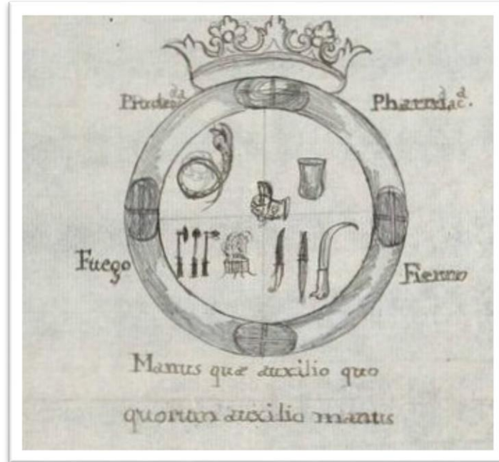
Figura 4. Escudo del Real Colegio de Cirugía de la Armada de Cádiz