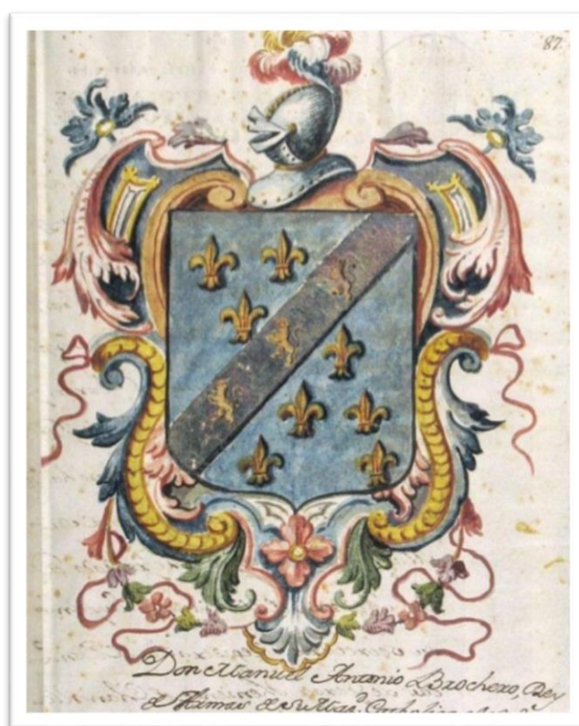
Figura 3. Escudo de armas de Pedro Virgili