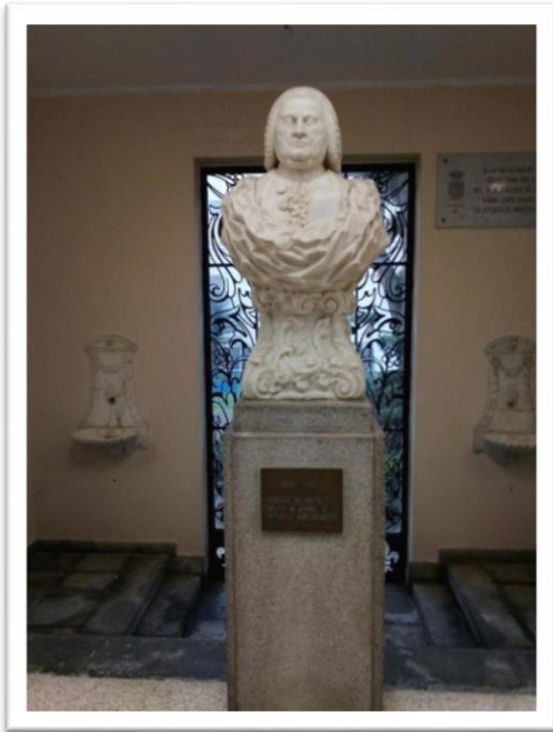
Figura 7. Busto de Pedro Virgili