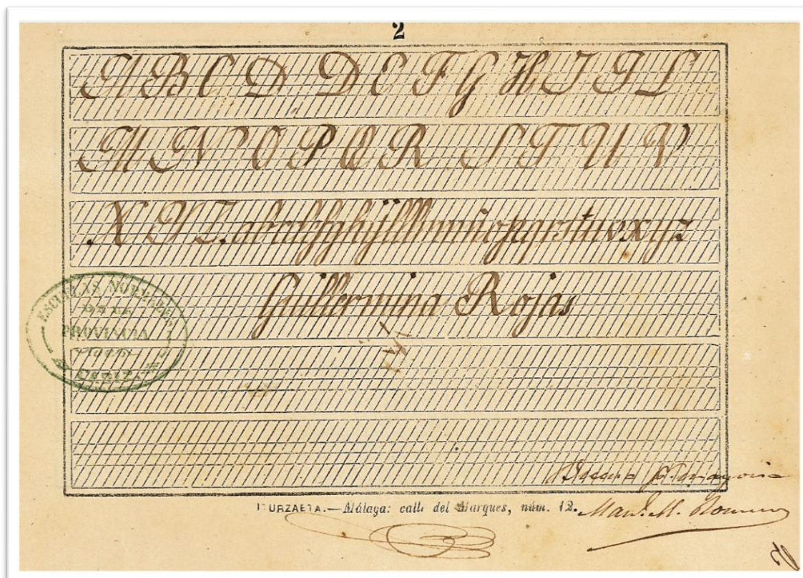
Figura 2. Planilla caligráfica presentada por Guillermina Rojas en el examen como maestra superior