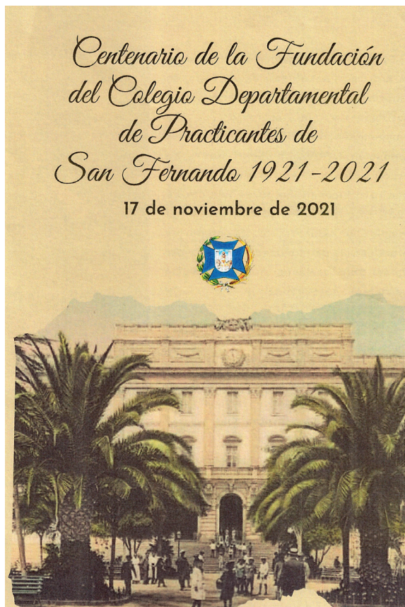
FIGURA 3. Programa del Centenario de la Fundación del Colegio Departamental de Practicantes de San Fernando (1921-2021)

Fuente: Grupo Investigación Historia de la Enfermería Gaditana, Colegio Enfermería Cádiz