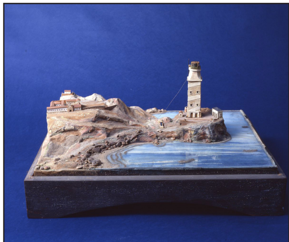
Fig 5. La Torre de Hércules (c.1826), León Gil de Palacio

lo que lleva a pensar en un uso alusivo de los edificios para presentar el trabajo como un homenaje, recuerdo o representación del cuerpo de Artillería de La Coruña, lugar donde permaneció por más de diez años hasta 1823. 5 Gil de Palacio habría pasado del plano relieve militar al civil, siendo su primer modelo conocido una reinterpretación de la topografía castrense: una mirada artística a ese ámbito para seleccionar aquellos escenarios que identifican un espacio desde el punto de vista marcial (fig. 5).