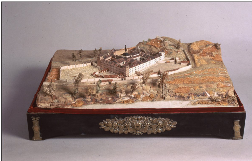
Fig 6. Convento de Nuestra Señora de Prado, Valladolid (1828), León Gil de Palacio

«decidieron la suerte de Gil de Palacio» (Quirós Linares, 1999: 213), pues gustaron al monarca, que mandó acelerar su purificación, como se ha dicho, y adscribirlo al Museo de Artillería en octubre de 1828.