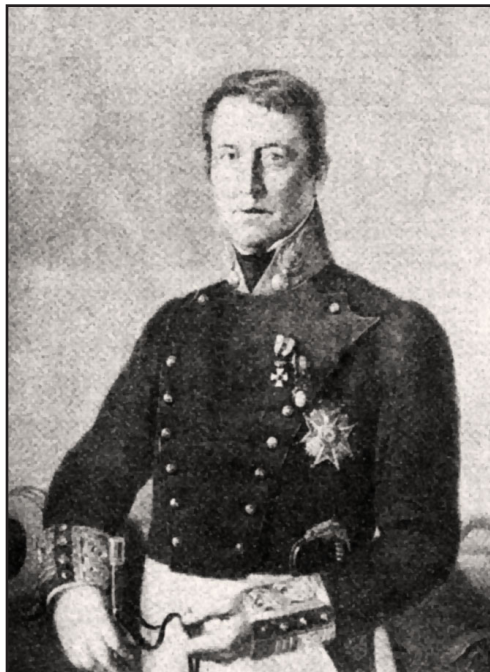
Fig 4. León Gil de Palacio (Anónimo), de la Biografía del señor don León Gil de Palacio (1892) de Silbén Cordal (Biblioteca Nacional de España, sign. 1-10067)

Como alumno de la Real Academia Militar Facultativa, sus estudios cayeron dentro del ámbito de la ingeniería, a los que luego añadió los de artillero. De esta forma, sus biógrafos, junto a sus aptitudes para la topografía y la arquitectura, destacan sus sólidos y extensos conocimientos en geometría, álgebra, cálculo, matemáticas, diseño militar, táctica, fortificación, esgrima, geografía, historia, lenguas francesa y española. Fue autor de varias maquetas, algunas de las cuales presentó a las academias de Bellas Artes, de Valladolid y de Madrid, para que los expertos en arquitectura dieran su opinión —que siempre fue favorable— como técnicos en aspectos científicos, pero también artísticos. Si la arquitectura mezclaba la belleza con la utilidad, él llevó a cabo este precepto con sus diseños artístico-topográficos, en lo que no hacía más que seguir la tradición de antiguos tratadistas. Tenía sensibilidad histórica, estética y estaba al tanto de las corrientes contemporáneas sobre adornos, coleccionismo y uso institucional del arte.