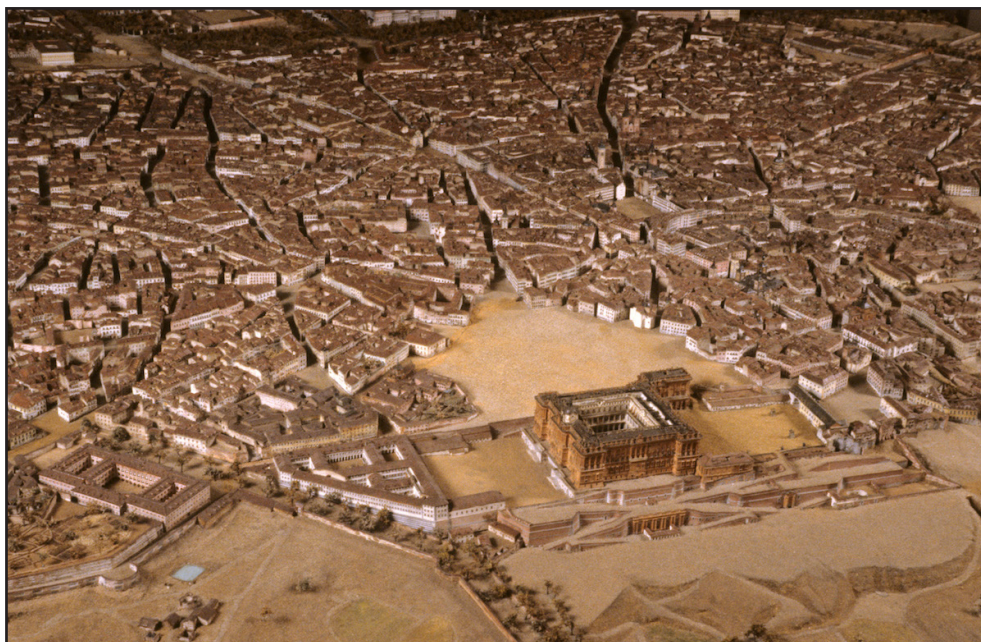
Fig 13. Detalle del modelo de Madrid (1830).

distinto del seguido por Espinosa de los Monteros en 1769 y años después en el ya citado plano inspirado por Fermín Caballero, que en 1848 publicaron Madoz y Coello en el Atlas de España y sus posesiones de Ultramar o Diccionario geográfico-estadístico-histórico , en el que señalaron también edificios e infraestructuras «proyectados» como el «Mercado de los Mostenses» y el «Embarcadero para el Camino de Hierro» (estación de Atocha), así como «todas las reformas que han ocurrido hasta la fecha». 40