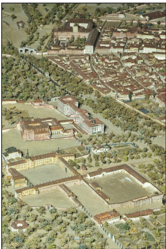
Fig 11. Detalle del modelo de Madrid (1830). Vista del Salón de Reinos, del Casón y del Museo del Prado, al fondo el Hospital General

A este director debió grandes adelantos el Museo, y si bien es cierto que la decoración de los salones era un poco recargada y de gusto algún tanto antiguo, con profusión de tarjetones llenos de letreros y adornos de madera y cartón dorado, según decía después su sucesor para justificar las acentuadas reformas que introdujo, debido era a lo exiguo de la asignación, insignificante para el sostén y progreso de un establecimiento de la importancia y necesidades del Museo (1876: 33). 35