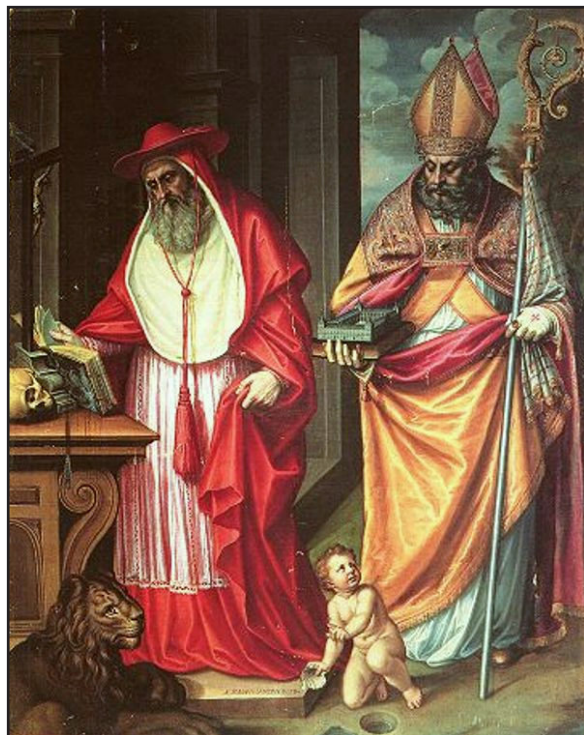
Fig 1. San Jerónimo y San Agustín , Alonso Sánchez Coello (Monasterio de San Lorenzo de El Escorial)