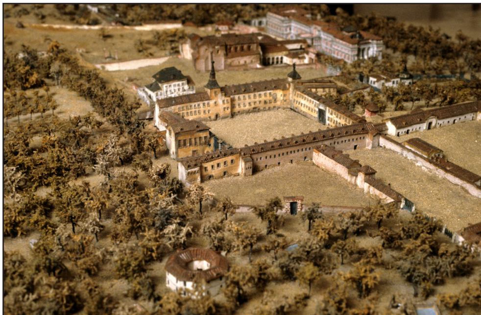
Fig 9. Detalle del modelo de Madrid (1830). Vista del Salón de Reinos y del Casón, el Museo del Prado, arriba a la derecha