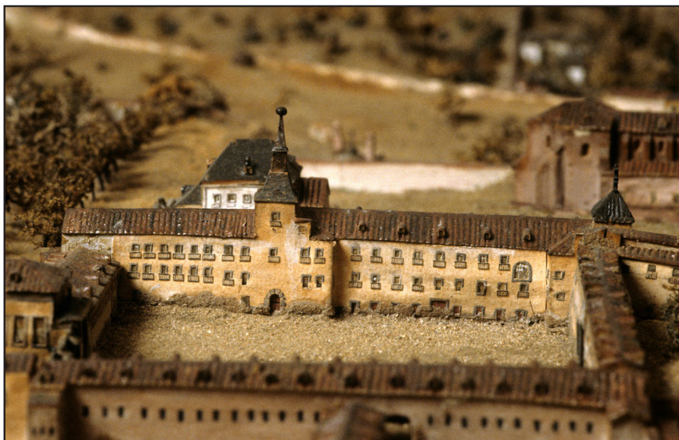
Fig 10. Detalle del modelo de Madrid (1830). Vista del Salón de Reinos y del Casón; detrás a la izquierda