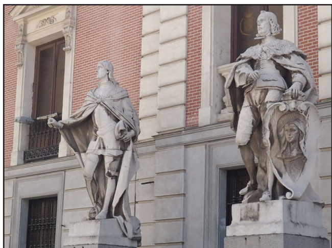
Fig 8. Dos de los seis reyes que actualmente se encuentran en la fachada del Salón de Reinos

Palacio con sus dos estatuas colosales perseguía el mismo objetivo, lo que proporcionaba al visitante la experiencia de que tanto lo que había dentro como el propio edificio eran importantes: un espacio que, como el Museo, representaba a la nación. Por otro lado, se observa la tendencia heredada y continuada en siglos posteriores a convertir esa zona del Prado en centro cultural y de representación.