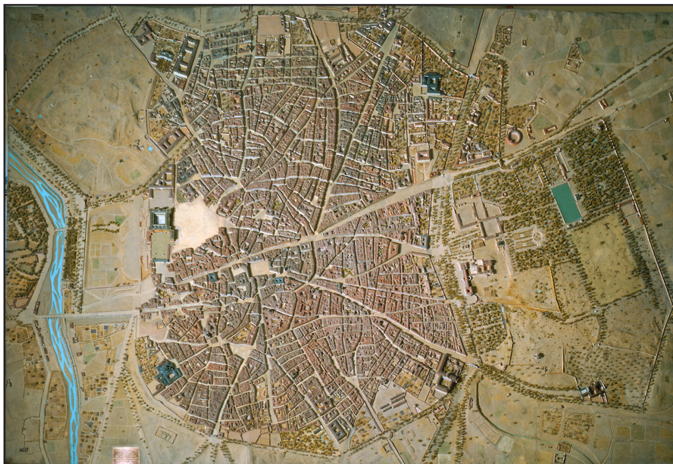
Fig 12. Panorámica cenital del modelo de Madrid (1830)

de la capital. Finalmente fueron veintitrés los meses empleados. Recuérdese que Jiménez empleó también dos años en hacer su modelo de Cádiz, aunque era menos complejo. Gil siempre trabajó rápido, lo que da cuenta de la calidad de sus habilidades y del numeroso equipo que llevaba a cabo las mediciones urbanas y la construcción material del modelo. Tuvo bajo sus órdenes a los subtenientes José Bielsa y Patricio de la Escosura, después famoso literato y político, además de a «los obreros necesarios» del taller que se montó en el Museo, en el que, junto al de Madrid, se construyeron otros modelos para enseñanza militar por indicación de Carlos O'Donnell, de manera que Gil de Palacio compatibilizó durante unos años la construcción de maquetas civiles y para el ejército (Carrasco, 1876: 24).