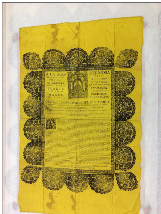
Fig. 4 Tesis de grado de Domingo de Monesterioguren (F. Vives).

Este segundo ejemplar conservado en Vitoria, a pesar de cumplir las características generales expuestas anteriormente, muestra algunas diferencias en cuanto al formato y al contenido. Respecto al grado académico a obtener, en ningún apartado del mismo se concreta, solamente en la parte final, la relativa a las conclusiones, se hace referencia a que son teológicas. 12 Por otro lado, la única información que se puede sustraer del documento con respecto al autor, Domingo de Monesterioguren, es que fue un fraile dominico del convento de Santo Domingo de Vitoria, pues es allí donde se anuncia la defensa para el 26 de octubre de 1768 13 bajo el magisterio del también fraile dominico Martín Larrayoz, lector de Sagrada Escritura del dicho convento vitoriano, y porque además la primera parte de la dedicatoria, que ocupa el tercio superior del documento, se hace a la imagen de la