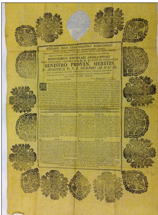
Fig. 6. Tesis de grado de Benigno María de Urien (F. Vives).

El desarrollo ornamental es muy similar a la hoja de Domingo de Monesterioguren, en cuanto que algunos de los motivos de la orla se repiten. 14 El texto se encuentra enmarcado primeramente por una pequeña cenefa para después quedar todo ello remarcado por una serie de motivos que son el resultado de la aplicación de tacos de madera sin un elemento unificador. De estos tacos, se presentan tres modelos: en primer lugar, en las cuatro esquinas y en el centro de los lados menores, un elemento de forma romboidal festoneado con motivos vegetales que encierra en su interior un jarrón con dos asas que acoge tres grandes ramas con una flor abierta en cada una de ellas. 15 En segundo lugar y en cada uno de los lados mayores, dos arcos festoneados del mismo modo y encerrando en su interior el mismo jarrón con dos asas de cuyo interior salen cinco ramas con grandes flores abiertas. Por último, y en tercer lugar, flanqueando los elementos romboidales en los lados menores y alternándose con los arcos en los lados mayores, unos jarrones de dos