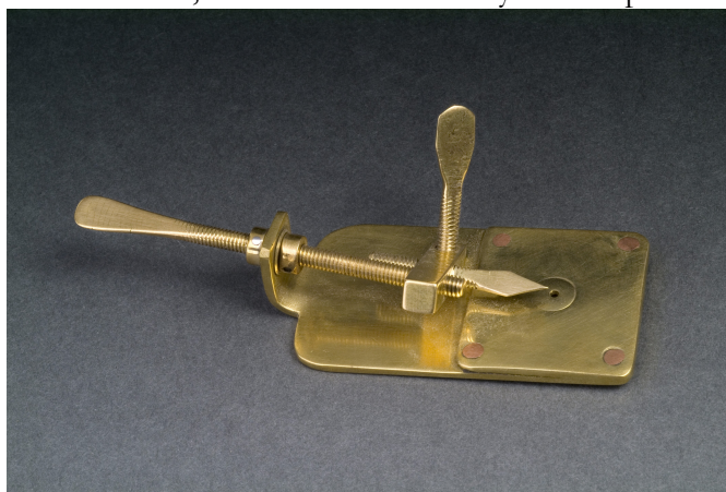
Figura 1. Réplica a escala de uno de los microscopios de Leeuwenhoek.

Los avances técnicos han propiciado muchos descubrimientos científicos. Un ejemplo de esto es el desarrollo de los microscopios y el conocimiento de la célula. A la teoría celular se llegó gracias a una serie de descubrimientos científicos que estuvieron ligados a la invención y desarrollo de los microscopios. Anton van Leeuwenhoek (1632-1723) fue uno de los pioneros en el estudio del mundo microscópico. Este holandés, comerciante de telas y contemporáneo de Robert Hooke, aunque carecía casi por completo de formación científica, construyó como entretenimiento diminutas lentes biconvexas montadas sobre placas metálicas que se sostenían muy cerca del ojo. A través de ellas podía observar objetos, que montaba sobre la cabeza de un alfiler, ampliándolos hasta trescientas veces. Durante años se dedicó a examinar con sus microscopios todo lo que tenía a su alcance y fue el primero en la historia que observó células vivas. Realizó detalladas observaciones de