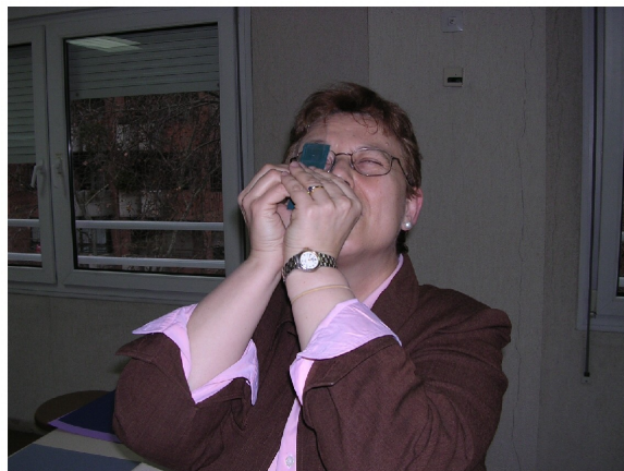
Figura 4. Modo de utilizar el microscopio.

Para conseguir un microscopio de Leeuwenhoek que permita observar las preparaciones con nitidez hay que fabricar un número alto de esferas para seleccionar las adecuadas de tamaño y esfericidad. Se recomienda algo de paciencia, como la que tuvo Leeuwenhoek.