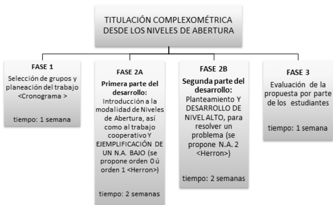
Figura 1. Estructura metodológica general.

Nivel 1: estudiantes que han realizado muy pocas o ninguna práctica de laboratorio.