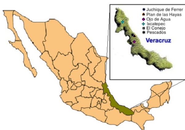
Figura 1. Localización de las comunidades de estudio en el estado de Veracruz.

Con la finalidad de evaluar el impacto cualitativo de los asistentes se diseñaron dos encuestas basadas en el Manual Frascati (OCDE 2002), con las cuales se evaluaron y compararon los resultados obtenidos para discutir de esa forma si existió impacto en la población de forma inmediata que pueda persistir en el futuro próximo.