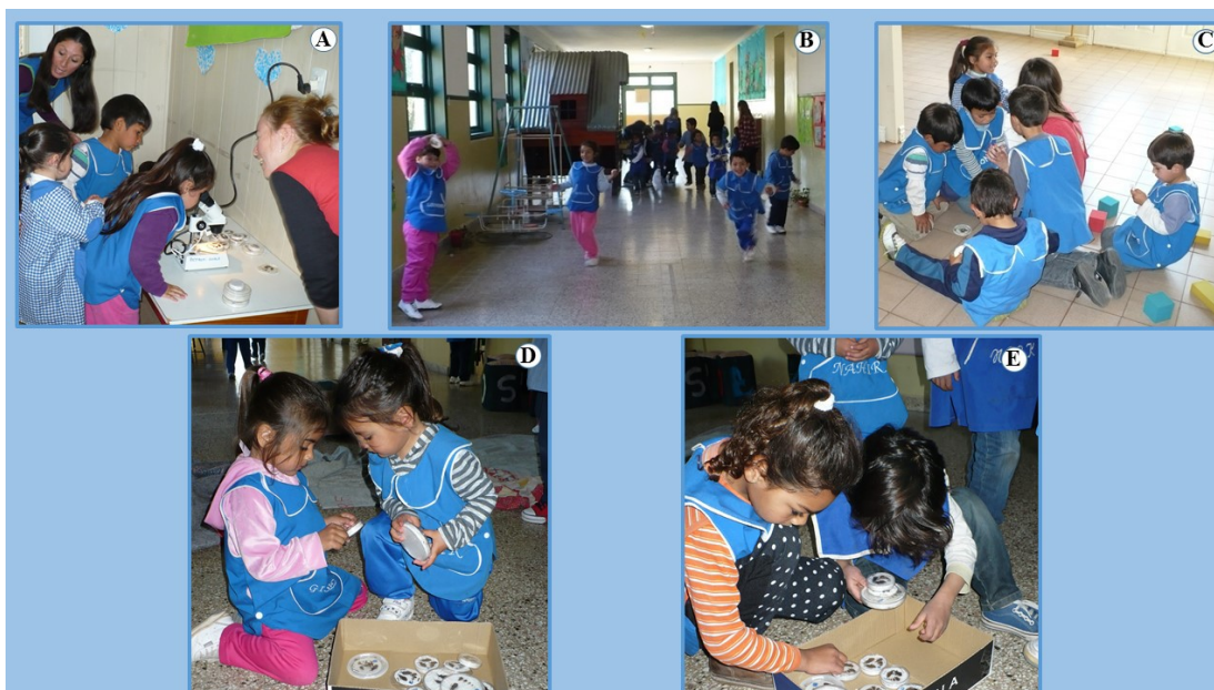
Figura 7. Secuencia de actividades realizadas en los Jardines del Núcleo N°5 del Dpto. Castro Barros, (La Rioja, Argentina). A) Observación de las diferentes etapas de desarrollo de Triatoma infestans (vinchucas) en lupa binocular. B y C) Actividad lúdica “Busquemos vinchucas en el Jardín”. D y E) Los alumnos analizan las vinchucas colectadas durante el juego.

Tras la observación detallada de los insectos, se propuso a los alumnos la realización del juego didáctico “A encontrar vinchucas en el Jardín”, el cual consistió en que los investigadores escondían las placas de petri con vinchucas en los lugares en que normalmente se pueden encontrar estos insectos: detrás de cuadros, en grietas o huecos de los muros, detrás de maderas, etc. Los niños debían buscar y encontrar las vinchucas y dejarlas en una caja (Figura 7). De esta forma los niños pudieron afianzar los conocimientos recibidos sobre cómo y dónde detectar las vinchucas para evitar la colonización de sus viviendas.