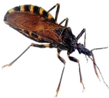
Figura 1. Los insectos triatominos son los vectores del parásito que causa la enfermedad de Chagas. En la imagen se observa un ejemplar de vinchuca ( Triatoma infestans ), principal transmisor del parásito Trypanosoma cruzi en Argentina.

Aunque la mayoría de los infectados son pobladores de América Latina, en los últimos años, la posibilidad de contraer la enfermedad se ha expandido hacia países no endémicos debido a los fenómenos migratorios (Schmunis, 2007; Schmunis y Yadon 2010). En el hemisferio norte, ha aumentado la proporción de donantes que pueden transmitir el parásito sin que existan instaurados medios para evitarlo (Coura y Albajar, 2010).