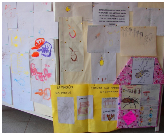
Figura 4: Dibujos realizados por niños de 4 y 5 años del Jardín “Carlos Menem (H)” de Anillaco, en colaboración con sus familias y expuestos en el hall de ingreso al Centro de investigaciones científicas CRILAR.