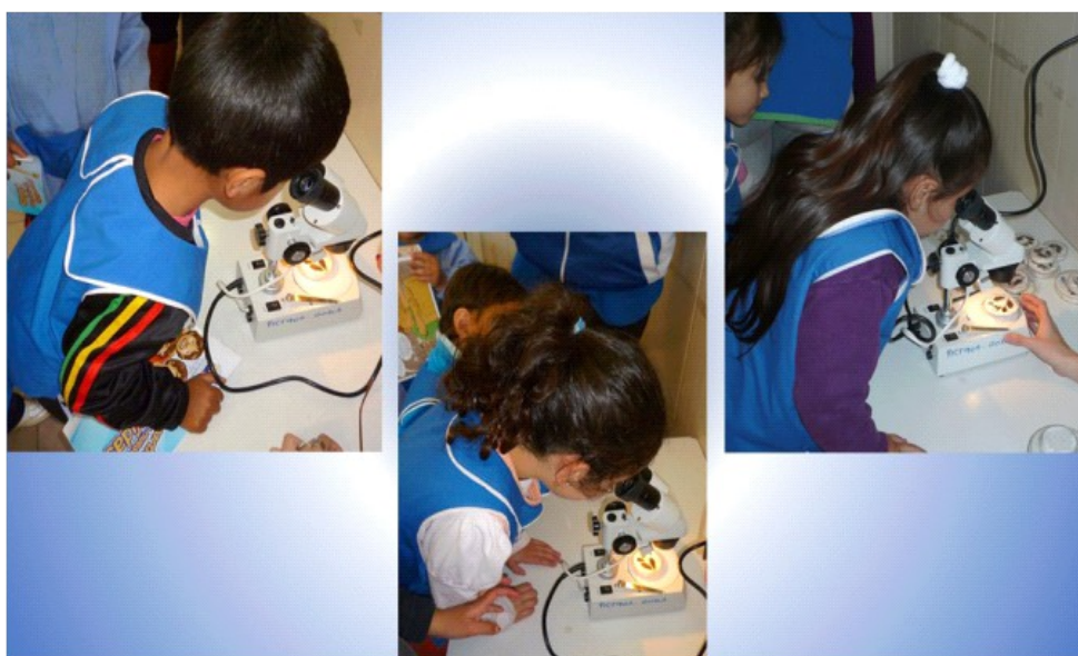
Figura 6: Utilización de lupa binocular para la observación de vinchucas (insectos vectores de la enfermedad de Chagas).

Tras la observación detallada de los insectos, se propuso a los alumnos la realización del juego didáctico “A encontrar vinchucas en el Jardín”, el cual consistió en que los investigadores escondían las placas de petri con vinchucas en los lugares en que normalmente se pueden encontrar estos insectos: detrás de cuadros, en grietas o huecos de los muros, detrás de maderas, etc. Los niños debían buscar y encontrar las vinchucas y dejarlas en una caja (Figura 7). De esta forma los niños pudieron afianzar los conocimientos recibidos sobre cómo y dónde detectar las vinchucas para evitar la colonización de sus viviendas.