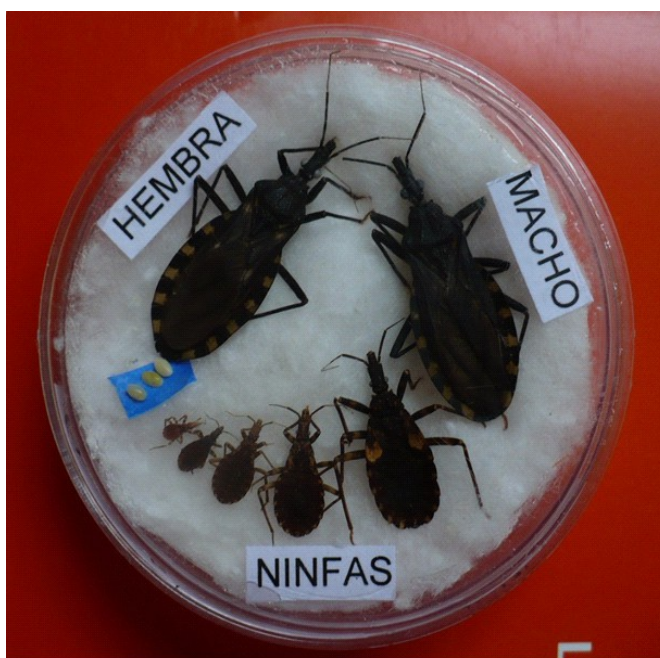
Figura 5. Ciclo de vida de la vinchuca ( Triatoma infestans ), insectos transmisores de Trypanosoma cruzi , agente causal de la Enfermedad de Chagas.

Se realizó una indagación guiada para que los alumnos observaran las similitudes y diferencias entre los adultos y las ninfas (estadios inmaduros) del insecto. Posteriormente, para favorecer la apropiación del aprendizaje, se propuso que los alumnos observaran e identificaran las características de mayor relevancia de los insectos, utilizando una lupa binocular (Figura 6).