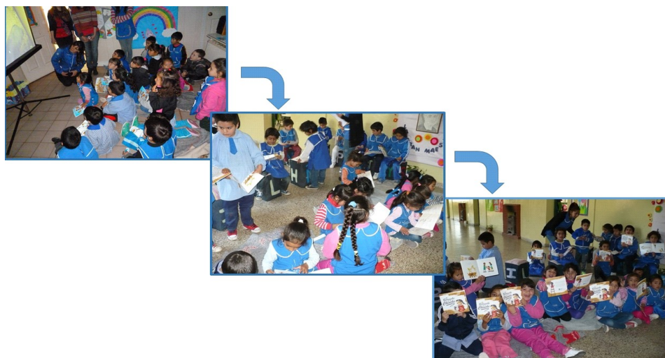
Figura 2. Secuencia de actividades realizadas con los alumnos del Jardín Carlos Menem (H) durante la intervención. Presentación de una película animada y audio del libro de cuentos “El berrinche de la chinche” (provisto por el Ministerio de Salud).

La intervención en el Jardín “Carlos Menem (H)” durante 2013 consistió en la proyección de un video animado (Ramsey Willoquet y Salgado Ramírez, 2008). Posteriormente, se aclararon y explicaron conceptos confusos o dudosos y se respondieron las consultas de docentes y alumnos (Figura 2). A continuación, se repartió a cada alumno un ejemplar del libro de cuentos “El berrinche de la chinche” (material proporcionado por el Ministerio de Salud de la Nación Argentina) y se escuchó el audio de dicho cuento mientras los alumnos seguían la historia en sus libros (Figura 2).