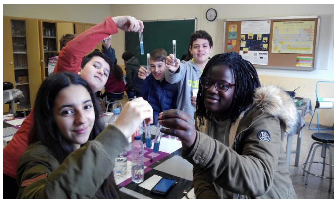
Figura 3. Alumnos de 1ºESO del Institut Marta Estrada, de Granollers, participando en el Projecte Rius , un proyecto de Ciencia Ciudadana que monitoriza colaborativamente el estado biológico, físico y químico de varios ríos de Catalunya. www.projecterius.cat/

Por otro lado, la Investigación e Innovación Responsable (RRI en sus siglas en inglés) propone vincular la ciudadanía con los centros de investigación e innovación para que los ciudadanos puedan participar en la definición de políticas de innovación. Distintos proyectos (Engaging Science, RRI Tools, PlayDecide, IRResistible 2 ...) generan recursos para el profesorado y la ciudadanía en general (Alcaraz-Domínguez,