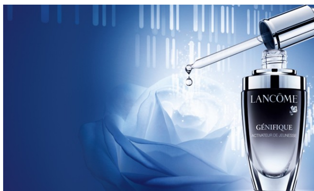
Figura 1. Publicidad de crema cosmética con referentes científicos para ser analizada mediante el test CRITIC. ¿Cuál es la afirmación? ¿Qué interés tiene su autor? ¿Ofrece datos? ¿Puede comprobarse? ¿Concuerda con lo que sabemos del ADN?

Las actividades para esta instancia suelen promover la toma de decisiones en el marco de Conflictos. En esta instancia destacan las controversias Socio-Científicas (SSI, en sus iniciales en inglés), cuestiones o dilemas socialmente relevantes con vínculos conceptuales con la Ciencia, en las que participan valores personales y aspectos éticos y legales y que tienen respuestas abiertas y complejas (España y Prieto 2010, Jiménez-Aleixandre 2010, Solbes, 2013). Además de preparar al alumnado en la toma de decisiones participadas por la ciencia, el uso de controversias permite hacer emerger posibles concepciones erróneas (Domènech-Casal 2014a). Las controversias pueden vincularse a distintos ámbitos: sostenibilidad, salud, seguridad, desarrollo tecnológico... y ser de distinta envergadura: personales («¿Qué coche me compro?») o sociales («¿Hay que prohibir el diésel?») (Díaz y Jiménez-Liso 2012, Domènech, Márquez, Marbà y Roca 2015). En el aula, el marco CSCFrame propone la articulación de las SSI en tres etapas: Lectura Crítica, Debate y Ensayo, en las que el alumnado argumenta y se posiciona ante un dilema (Figura 2., Domènech-Casal 2017) con la ayuda de distintos andamios.