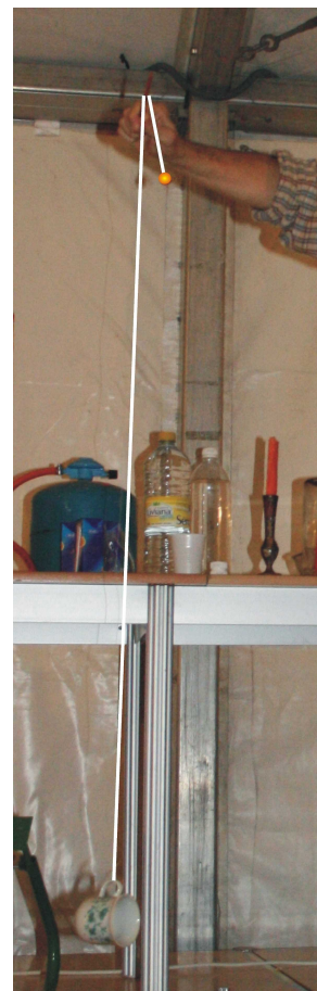
Figura 2.- La taza no llega al suelo y se salva de hacerse añicos... ¡gracias a las leyes de la Física!

Puede explicarse el sorprendente resultado de esta experiencia recurriendo a conocimientos básicos del movimiento de un péndulo ideal, lo cual resulta asequible para estudiantes de Secundaria y el público en general. Para ello sólo hay que saber que el periodo T de un péndulo aumenta con su longitud L (no es necesario saber la forma exacta, pero se puede recordar que la relación es T = 2\pi \sqrt{L/g} ). El péndulo al que nos hemos referido estaría formado por el abalorio que sostenemos con la mano B y el hilo que lo une a la varilla. Al soltar el abalorio, este péndulo tiene una longitud L grande y, por lo tanto, su movimiento es lento ( T grande). Pero L disminuye muy