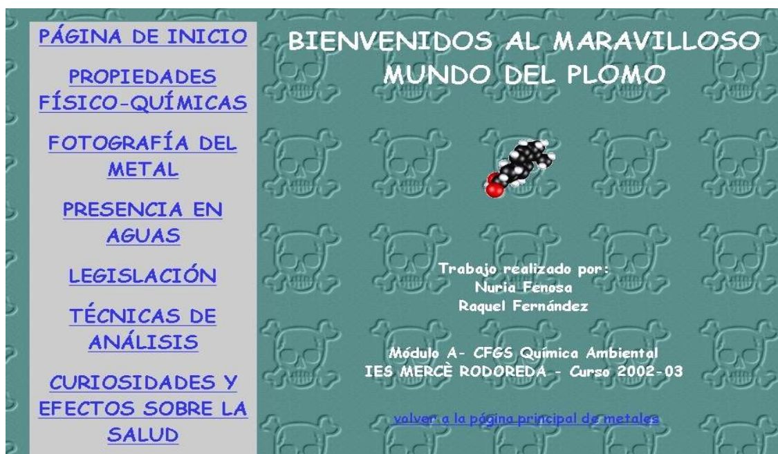
Figura 5.- Página principal del trabajo realizado sobre el plomo.

Una vez que el alumnado había adquirido las habilidades básicas del BSCW y del Netscape Composer, empezaron a trabajar sobre el proyecto asignado: cada grupo cooperativo debía realizar una serie de diferentes páginas web sobre un metal en concreto y su presencia y análisis en aguas. Cada grupo cooperativo, en cada grupo-clase, debía realizar el proyecto sobre un metal diferente. El sistema de derechos de acceso del BSCW permitía que todo el alumnado de un mismo grupo-clase pudiera ver el progreso y el trabajo del resto de compañeros de su grupo-clase y, por tanto, aprender con aquello que sus compañeros iban haciendo, además de compartir información en la carpeta de grupo-clase. Los proyectos asignados a los grupos cooperativos de los tres grupos-clase eran independientes y esto permitió que pudiera haber proyectos sobre el mismo metal en grupos-clase diferentes.