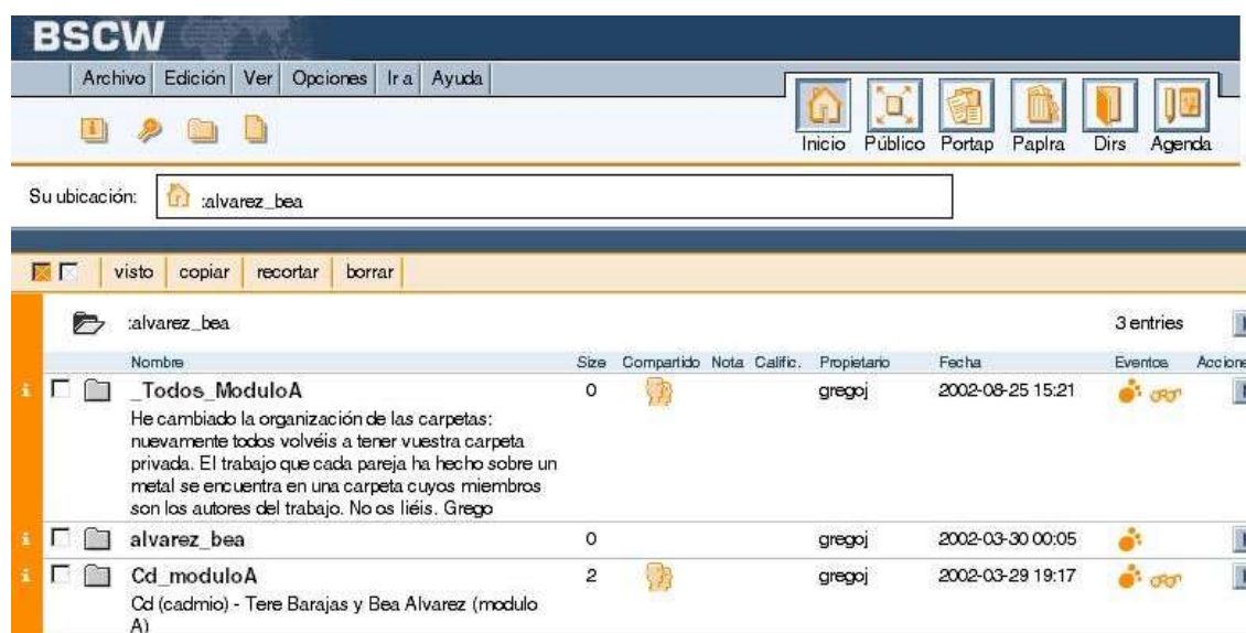
Figura 3.- Página de inicio de la alumna Bea Álvarez donde se observan tres tipos de carpeta: la personal ("alvarez_bea"), la de grupo cooperativo "Cd_moduloA" y la de grupo-clase "_Todos_ModuloA".

(carpetas). Hay que tener presente que la flexibilidad que permite el BSCW se debe a que no parte de ninguna estructura predeterminada: cuando uno se conecta al BSCW por primera vez justo después de registrarse encuentra un espacio totalmente desierto. A partir de aquí, el/la usuario/a crea su(s) propio(s) espacio(s) de trabajo donde va creando y colgando objetos (documentos, carpetas, foros de discusión, URLs...) y después puede "compartirlos" con aquellas personas con las que quiera trabajar cooperativamente. En este caso, cada uno de los estudiantes tenía acceso a tres carpetas: