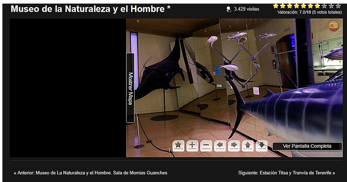
Figura 3. Imagen del “Museo de Naturaleza y Arqueología (MUNA)” de España.

Además, el análisis mostró que un 82% de los museos virtuales presentó un nivel alto en cuanto a la categoría información al usuario y facilidad de uso, mientras que sólo un 18% evidenció nivel medio. Sin embargo, al profundizar en otras categorías de análisis, se resalta que predominan imágenes en dos dimensiones, y que sólo el 21% posee imágenes en tres dimensiones y un alto grado de definición como puede observarse en las imágenes 3D de la Figura 3. Se considera que mientras mayor sea el grado de realismo en los museos virtuales, estos resultarán más atractivos y motivadores para los usuarios.