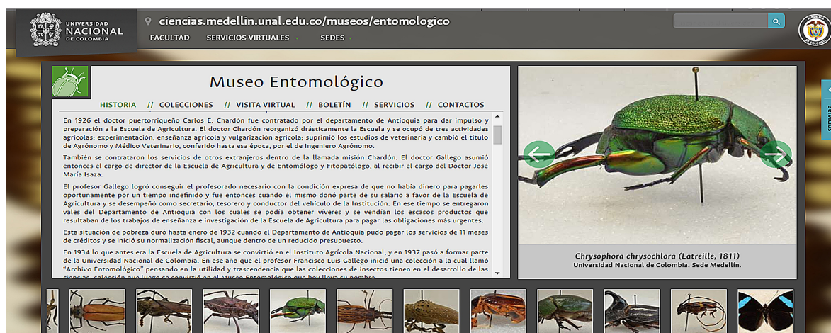
Figura 2. Imagen del “Museo Entomológico Francisco Luis Gallego” de Colombia.