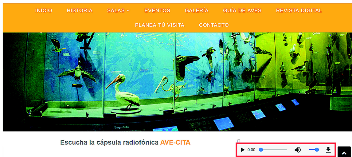
Figura 1. Imagen del “Museo de las Aves de México”.

Se destacó que la totalidad de los museos virtuales estudiados presentaron contenido multimedia, tal y como puede verse en la Figura 1, en la cual se observa la presencia de un audio que el usuario puede clicar para escuchar sonidos de aves y en la Figura 2, en la cual pueden visualizarse numerosas fotografías de distintos insectos para que el usuario identifique. Como señala Marquès-Graells (2000), las características multimediales capturan el interés de los usuarios, proporcionan información, posibilitan un trabajo individual y también en grupo, y, en este caso, orientan el aprendizaje y el pensamiento en torno a los contenidos de ciencias naturales.