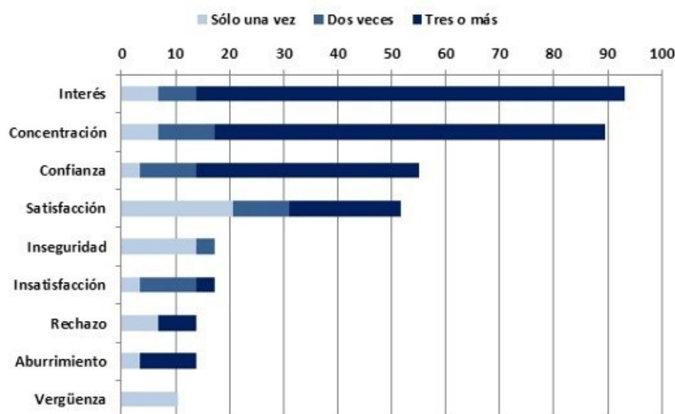
Figura 2. Porcentaje de estudiantes que a lo largo de la secuencia han experimentado cada emoción.

Los resultados obtenidos muestran que las emociones de interés y concentración han sido expresadas en tres o más ocasiones por más del 70% de los participantes, seguidas de confianza (41,4%) y satisfacción (20,7%).