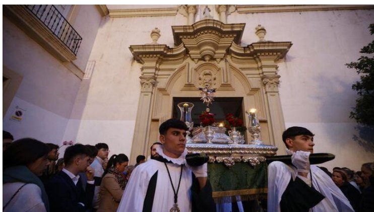
El Lignum Crucis de Vera -Cruz, saliendo de San Francisco.