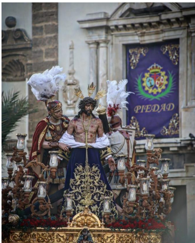
Despojado vuelve a su templo. Foto: Juan Manuel Sibón.2024

No se puede pasar por alto el pequeño caos que se vivió en esos momentos, mientras una ciudadanía entregada acompañaba a su Nazareno al que arropaban entre aplausos y hermosas palabras, insignias que dejaban el cortejo por el fuerte viento, dejando al Cristo y a su madre pasar por un Campo del Sur con muy fuertes rachas de viento, que incluso dificultaban el andar del propio cortejo, momentos de mucha tensión por el riesgo que suponía para los titulares. Se debe entender que los pasos no entran por la estrecha calle de Jabonería, que quizás hubiera sido más segura, lo que llevo a la junta a tomar esta decisión cuanto menos arriesgada.