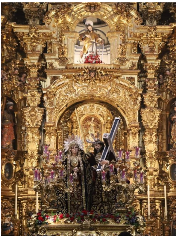
Afligidos en su templo. 2024. su estación de penitencia.

De un total de 31 hermandades únicamente procesionaron, contando con aquellas que salieron a la calle los días previos al Domingo de Ramos, 10 hermandades, de las cuales no todas realizaron completamente su estación de penitencia o tuvieron un recorrido estropeado por pequeños chubascos que preveían lo