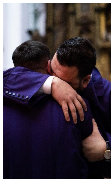
Abrazo entre hermanos de la Piedad. 2024

El Martes Santo despertó con una mañana soleada, entre algunos claros y nubes, son los partes meteorológicos imprecisos y que daban lugar a muchas dudas; dichas dudas fueron las que llevaron a las hermandades Piedad y Sanidad a tomar la decisión de no realizar su estación de penitencia. Pero el tiempo quiso dar una tregua al alma, y tras retrasar alguna que otra salida las hermandades de Ecce-Homo, Columnas y Jesús Caído salieron a las calles de Cádiz con un recorrido un poco más apresurado de lo habitual, algunas pequeñas gotas sin importancia en el camino y una salida procesional completa que llenó de alegría no solo a los hermanos de las hermandades mencionadas, sino al resto de los ciudadanos que miraban con alivio la continuidad de la Semana Santa gaditana.