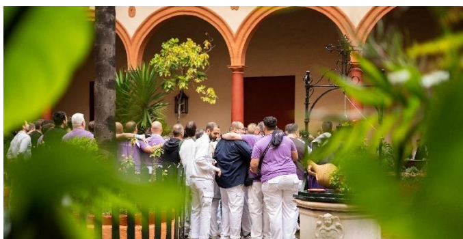
Cargadores en el patio de San Francisco. 2024

Nos encontramos también con que una lluvia repentina supone la reestructuración completa de una procesión, según en qué zona de la ciudad nos encontremos, por ejemplo, si nos remontamos al 2016 cuando la