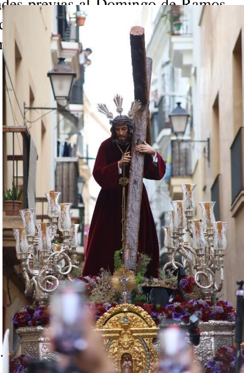
Nuestro Padre Jesús Nazareno de la Obediencia.

Empezaban los primeros rumores sobre una supuesta decisión que iba a tomarse bajo el Arco de las Puertas de Tierra, se escuchaba la canción de que llegarían hasta Catedral para buscar refugio en la misma y no volver a casa, pero lo que parecían