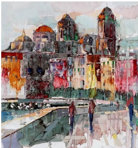
Autor. Francisco Luna Galván. 2º premio, XXII edición pintura rápida, 2019. Universidad de Cádiz

Igualmente, el respeto a las opiniones de los demás se hace imprescindible. Lógicamente, que no hemos de coincidir con la totalidad de ellas. Con esto, la recomendación se centra en el respeto (Amar, 2009, p. 183).