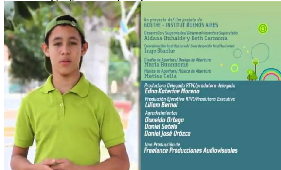
Figura 8 Contraseña Verde (2013) Escenografía de spot político