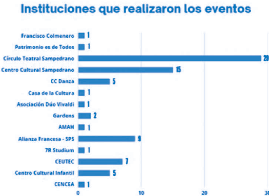
Figura 2: Instituciones que realizaron actividades durante todo el período de investigación 2015-2017.