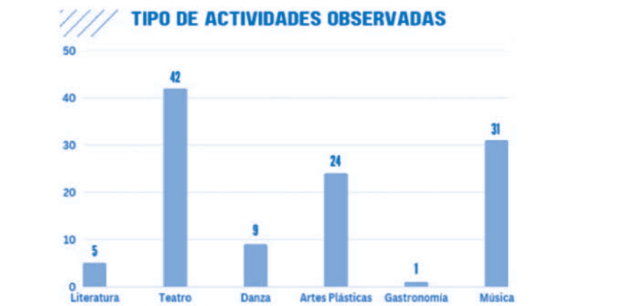
Figura 1: Tipo de actividades realizadas durante todo el período de observación 2015-2017.

Las instituciones más activas fueron Centro Cultural Sampedrano, Círculo Teatral Sampedrano, Alianza Francesa y Fundación Filarmónica de San Pedro Sula.