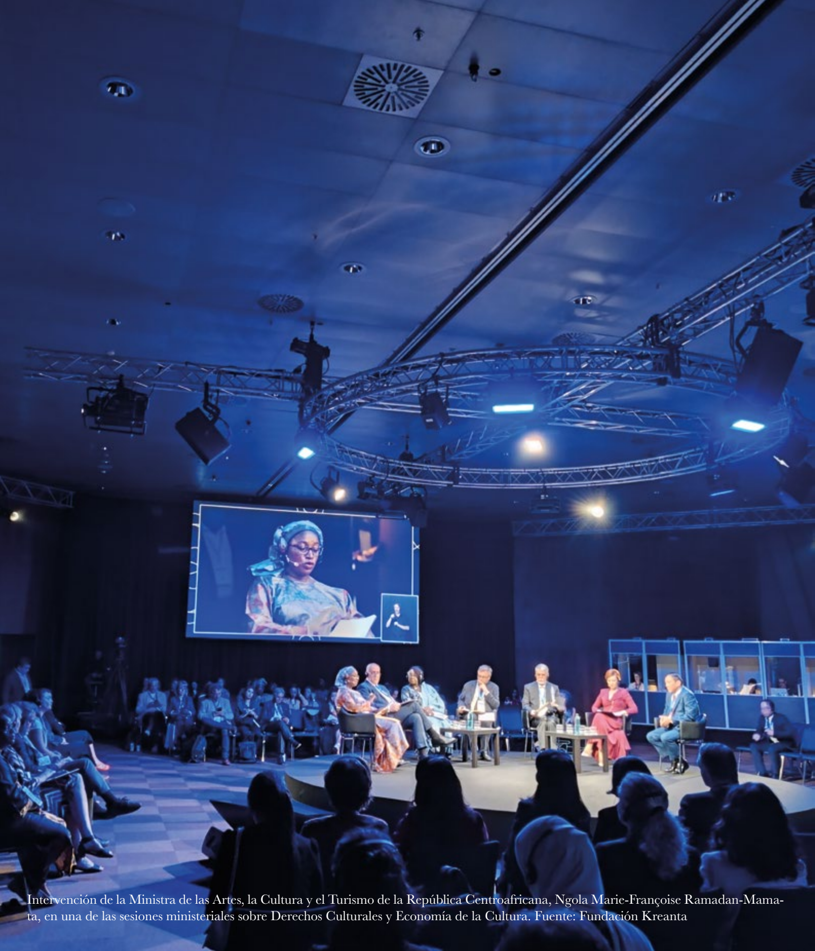
Intervención de la Ministra de las Artes, la Cultura y el Turismo de la República Centroafricana, Ngola Marie-Françoise Ramadan-Mamata, en una de las sesiones ministeriales sobre Derechos Culturales y Economía de la Cultura.