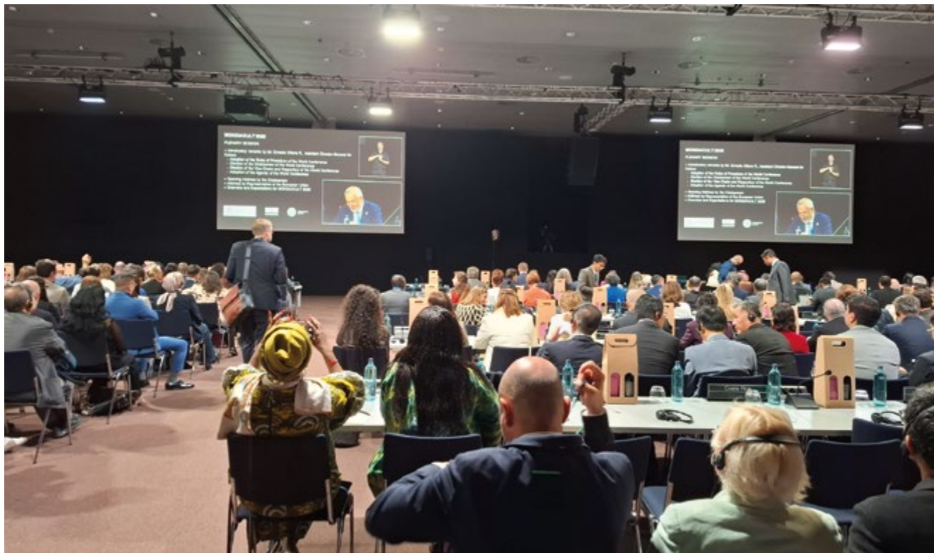
Intervención de Ernesto Ottone, subdirector general de la UNESCO, en la primera sesión plenaria de Mondiacult 2025.

incluidos los ocho temas principales de Mondiacult, que fue construida colectivamente a partir de contribuciones diversas (Estados y agentes culturales).