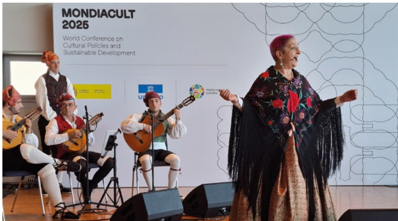
Actuación de jotás en Mondiacult 2025.