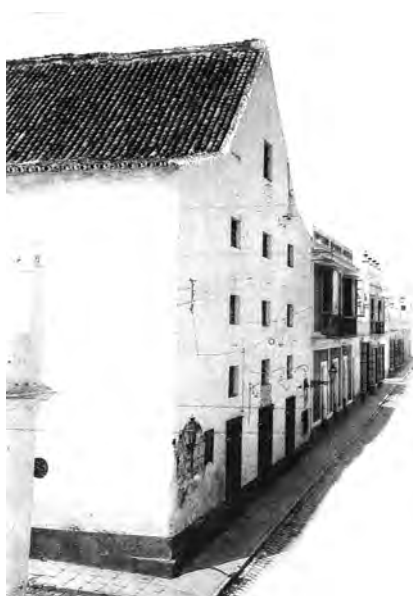
Teatro de las Cortes (1912).