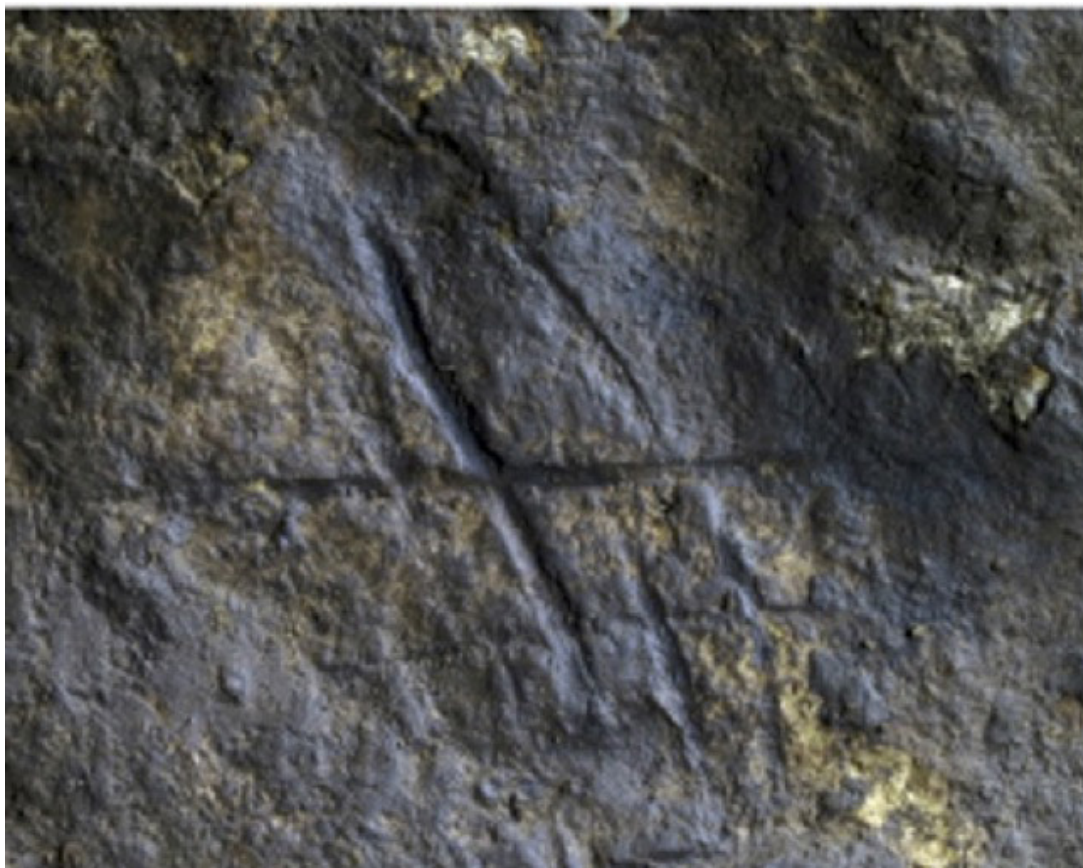
Figura 2. Grabado de la Cueva de Gorham, Gibraltar (Rodríguez-Vidal et al. , 2014).

fueron interpretadas como contenedores de pigmentos, probablemente usados como maquillaje corporal (Hoffmann et al. , 2018). Aunque también se encuentran estas actividades entre H. sapiens , existen evidencias simbólicas específicas de cada especie. Por ejemplo, según las evidencias arqueológicas de la cueva Fumane, 44ka, Italia, los neandertales cazaban aves exóticas, no para su consumo alimenticio, sino para usar su plumaje como adorno (Peresani et al. , 2011). De manera similar, en dos yacimientos, en la cueva Rio Secco, 49ka, y en la cueva Madrin, 50ka, abunda el uso decorativo de las garras de águilas, que fue comprobado a través de la arqueología experimental (Figura 3) (Romandini et al. , 2014). Estas evidencias aparecen mucho antes en Kaprina, Croacia, con una datación de 130ka (Figura 4) y junto con otros símbolos como grabados en piedra y huesos (Frayer et al. , 2020).