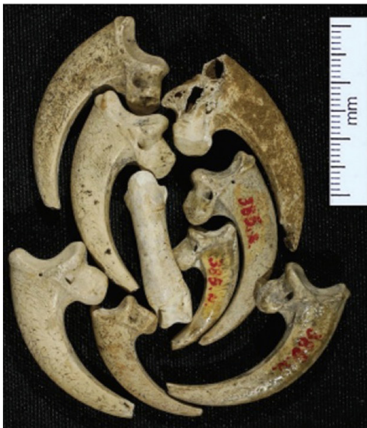
Figura 4. Garras de águila perforadas en yacimiento croata (Frayer et al. , 2020).

supervivencia. En un estudio reciente, Street y sus compañeros (2017) argumentan que el aprendizaje social es incrementado por una larga esperanza de vida y por el tamaño de grupo entre los primates. Ni una mutación neuronal, ni una estructura cerebral particular son necesarias para la comunicación social. Los usuarios deben ser mínimamente conscientes de que las mentes de otros son iguales que las suyas (teoría de la mente – ToM) y que perciben el mundo como ellos mismos lo hacen. De esta manera, pueden estar seguros de que otros usuarios entenderán lo que ellos intenten compartir. A través de las percepciones e interpretaciones, los miembros pueden expresar información. Esta información compartida está basada en los enlaces sociales y el trasfondo cultural entre los miembros. El ejemplo contrario describiría cómo algunos insectos segregan químicos para comunicarse, pero su comunicación no es cultural sino biológica (hasta ahora). Por otro lado, las especies sociales como los primates y cetáceos se comunican intencionalmente en contextos específicos y son capaces de callar o mantenerse estáticos cuando el ambiente cultural no es apropiado. En este sentido, argumentaría que, aunque hay otros