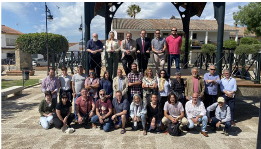
Figura 1. Imagen grupal de los asistentes a las Jornadas.