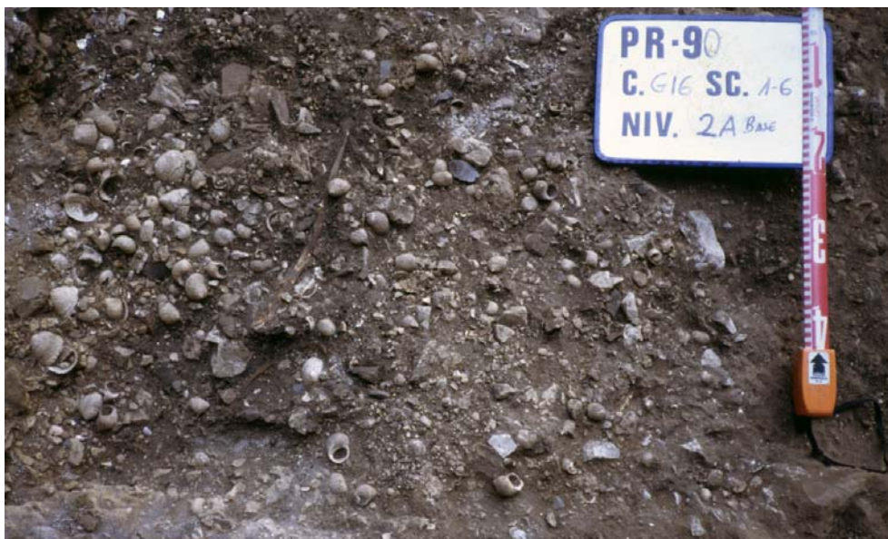
Figura 5. El conchero aziliense del Abrigo de la Peña del Perro en proceso de excavación durante la campaña de 1990.