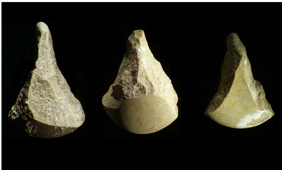
Figura 1. Picos asturienses procedentes de Mazaculos II.

A principios del siglo XX, a los eruditos locales, como el Padre Sierra o Alcalde del Río, se van a unir una serie de investigadores procedentes de otros países, y juntos van a dinamizar la investigación arqueológica en la región. Comienza así una larga tradición de investigadores extranjeros trabajando en el Cantábrico, dominada en estos primeros momentos por la escuela francesa (Straus y Clark, 1978:292), a través del Instituto de Paleontología Humana de París, creado por el Príncipe Alberto I de Mónaco. Entre estos investigadores extranjeros destacan las figuras de Breuil, Harlé y Obermaier.