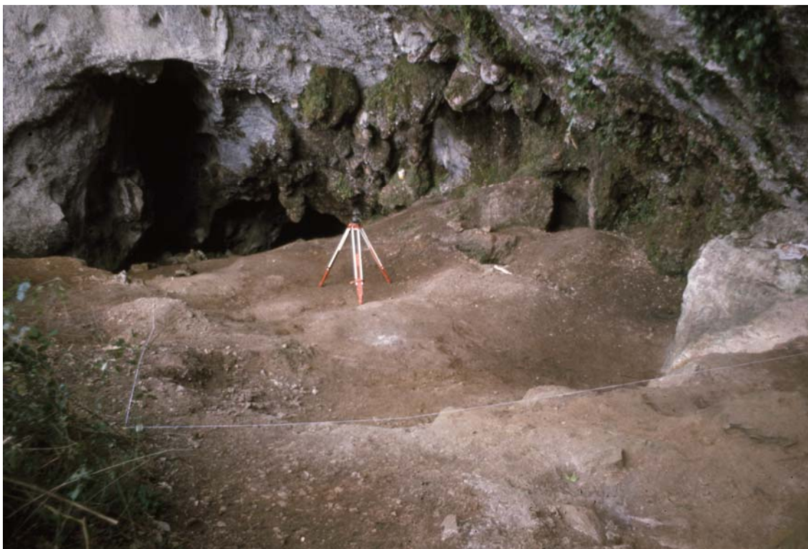
Figura 2. El conchero asturiense de la cueva de Mazaculos II

recogerá otras citas de Asturiense en Cataluña y Galicia, algo que será revisado posteriormente por otros autores (Clark, 1976; González Morales, 1982). Obermaier establece la secuencia cronológica del Paleolítico y el Mesolítico en el Cantábrico siguiendo las líneas de la aceptada cronología francesa (Straus y Clark, 1978:293). Sin embargo, a pesar de excavar en múltiples yacimientos con evidencias de explotación del medio marino, no se dedica a estudiar la explotación del litoral en detalle, como hizo Vega del Sella.