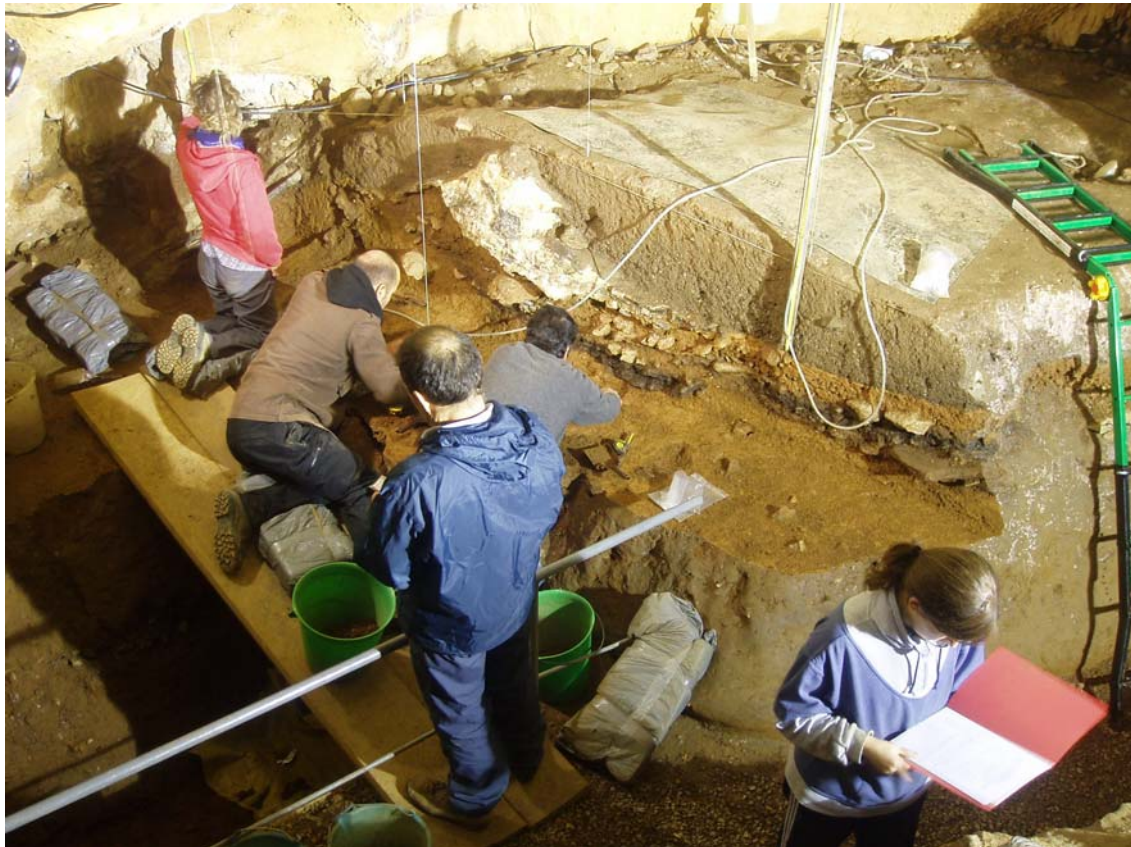
Figura 6. Excavaciones recientes en Santimamiñe.

Especialmente destacable es el hallazgo, entre el material de los niveles neolíticos, de las primeras conchas utilizadas como herramientas de la prehistoria cantábrica (Gutiérrez Zugasti et al. , en prensa b). También recientemente, las intervenciones realizadas en Linatzeta (Tapia et al. , 2008) han puesto de manifiesto la existencia de moluscos en el yacimiento, que han sido analizados por Álvarez Fernández (marinos) y Gutiérrez Zugasti (terrestres).