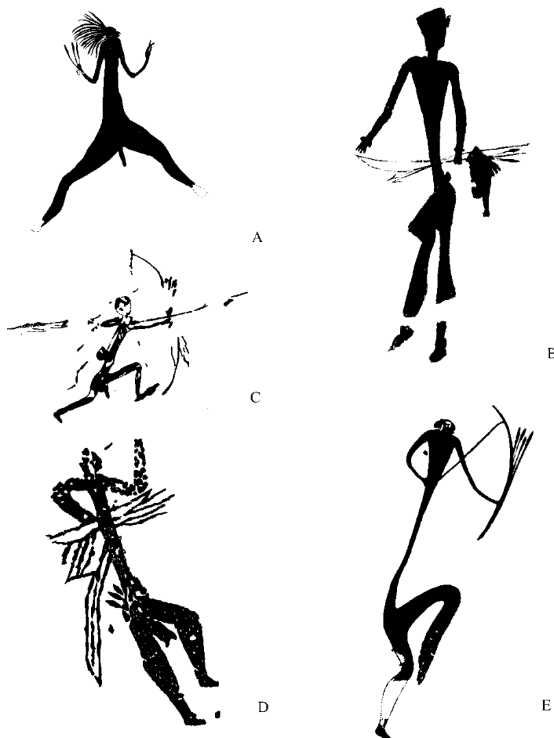
A: Cueva de la Vieja (Alpera, Albacete). Según Cabré (1915: fig. 97). B: Abrigo del Ciervo (Dos Aguas, Valencia). Según Jordá y Aleacer (1951: lám. III). C: Cueva Remigia (Arcs del Maestre, Castellón). Según Viñas y Sarria (1978: Fig. 2). D: Benirrama (Vall de Gallinera, Alicante). Abrigo I. Panel 4. Según Hernández, Ferrer y Catalá (1988: fig. 265). E: Covas dels Civil o Ribesals (Tirig, Castellón). Abrigo III. Según Obermaier y Wernert (1919: lám. VII).

se han encontrado dos arcos, mientras que en cambio se encontraron siete hoces y una cuarentena de palos apuntados y biapuntados lo que refuerza la idea de la mayor importancia de las actividades agrícolas y ganaderas (Bosch et al. 2006). Esta diferencia pone de manifiesto que lo que se muestra socialmente y se socializa al resto de la comunidad por los poderes dominantes, no se corresponde con lo que realmente sucede (actividades económicas) en los asentamientos documentados en los yacimientos registrados, como La Draga