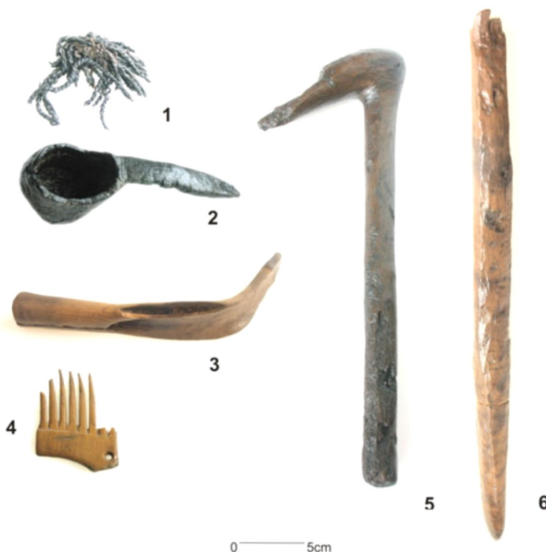
Figura 2. Objetos de madera del yacimiento neolítico de La Draga: 1. cuerda, 2. cucharón, 3. hoz, 4. peine, 5. mango de azuela, 6. palo cavador.

alrededor de una cuarentena de palos apuntados y biapuntados. Se trata de un conjunto que a priori puede parecer muy heterogéneo en lo que se refiere a materias primas empleadas para su fabricación ( Buxus , Quercus , Corylus , Laurus , Arbutus , Pomoideae ). También es heterogéneo en lo que se refiere a sus dimensiones (longitud y diámetro) y tipos de soporte empleados (ramas apenas apuntadas en sus extremos, cuartos y medios troncos segmentados). Por lo que parece que posiblemente nos encontramos en realidad con instrumentos que pudieron haber tenido usos diversificados