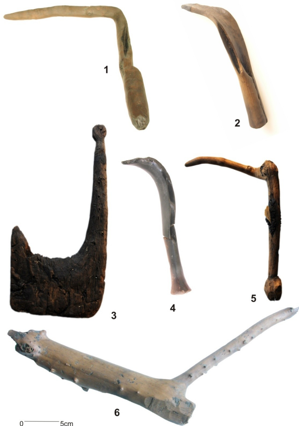
Figura 3. Hoces de madera del yacimiento neolítico de la Draga. 1 a 5 mangos de hoz y hoces. 6 mango en proceso de elaboración.

las personas que la llevaban a cabo. Hemos visto que en las necrópolis los proyectiles están principalmente asociados a individuos masculinos, cronológicamente estas necrópolis son más recientes que La Draga pero este rasgo es recurrente incluso en necrópolis de cronologías diferentes.