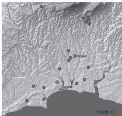
Figura 6: Cartografía de los lugares con evidencias del Período VI en el entorno territorial de la Bahía de Lagos

Los contextos funerarios del Periodo V de Alcalar que arriba hemos referenciado pueden compararse a otros del Suroeste peninsular, en los cuales se ha registrado la presencia de vasos campaniformes sin decorar, pero acompañados por objetos metálicos -puñales de lengüeta, puntas de cobre variantes del tipo Palmela- y brazales de arquero, artefactos que, en otras áreas, pueden aparecer asociados a los vasos campaniformes más tardíos y que fueron atribuidos por Schubart a un horizonte cronológico de Calcolítico final y a una «entidad arqueográfica» que denominó como Horizonte de Ferradeira (Schubart 1971; Schubart 1975: 115-129), según su concepto un periodo de «formación inicial» de la Edad del Bronce del Suroeste 15 que colocó en paralelo con el campaniforme tardío y con Argar A, tal y como Blance lo había definido en 1960 (véase Blance 1971). Este horizonte temporal se caracteriza en la Bahía de Lagos, y en otros locales del Algarve, por una alteración visible en los rituales funerarios, referenciada a un pequeño