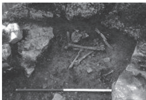
Figura 3: Fosa osario -777/-171

En los túmulos megalíticos, las criptas pudieron agrupar a algunos individuos; sin embargo, la utilización de los nichos permitió destacar los restos mortales de aquellos personajes notables que legitimaban su poder exhibiendo indumenta-