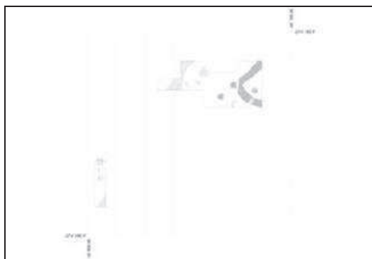
Figura 1: Planta Alcp16L. En gris oscuro las estructuras del Periodo V

de vasijas, evidenciando la acción del incendio que habrá casualmente cocido la tierra cruda de la construcción, obtenida en el mismo local del hábitat, ya antes ocupado.