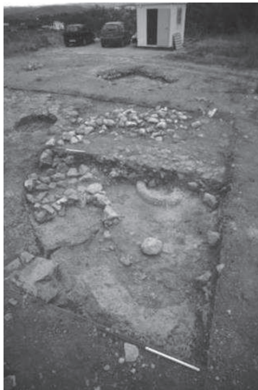
Figura 2: Casa 770/-170

una fecha entre 2198 y 1959 cal BC (Neves et al. 2009).