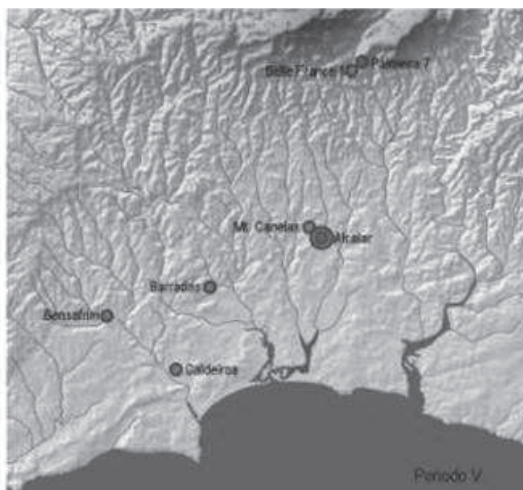
Figura 5: Cartografía de los lugares con evidencias del Período V en el entorno territorial de la Bahía de Lagos

que añadir las evidencias de hábitat de Barradas, ocupado desde el Calcolítico pleno (Silva y Silva 2005: 74-75, fig. 13, 97) y quizás el depósito del túmulo Belle France 1, con un hacha plana de cobre envuelto por tejido de lino (Soares y Ribeiro 2003; Soares 2013: 391).