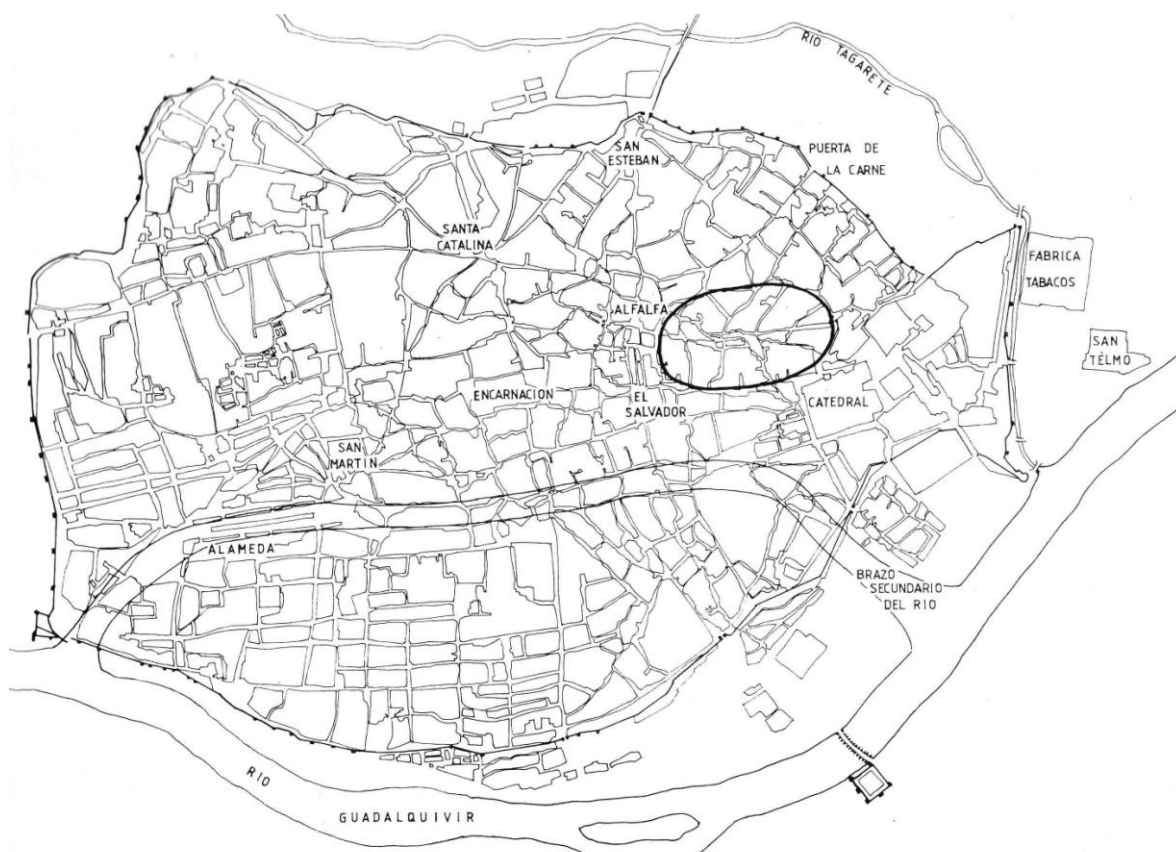
Figura 1. Elevación en la que se sitúa el asentamiento primitivo de la ciudad de Sevilla según Campos Carrasco (1986: 147)

Por otra parte, los trabajos arqueológicos desarrollados en la primera mitad del siglo XX tenían como objetivo prioritario conocer la evolución diacrónica del yacimiento, por lo que se realizaban generalmente sondeos estratigráficos, que permitían estudiar las secuencias cronológicas y culturales pero no conocer las dimensiones y plantas de las estructuras arquitectónicas. Las carencias metodológicas en el trabajo de campo y la difícil conservación de materiales constructivos, como el barro en sus diferentes formas y la madera, podrían explicar la falta de datos al respecto. La excavación realizada en la Cuesta del Rosario, en esta primera etapa de la Arqueología, se limitaba a recoger escasas referencias metrológicas sobre las estructuras constructivas, a veces un plano con la escala, las cotas y poco más, que por su reducido tamaño o por su insuficiente calidad no permite realizar cálculos sobre las dimensiones de las estructuras documentadas.