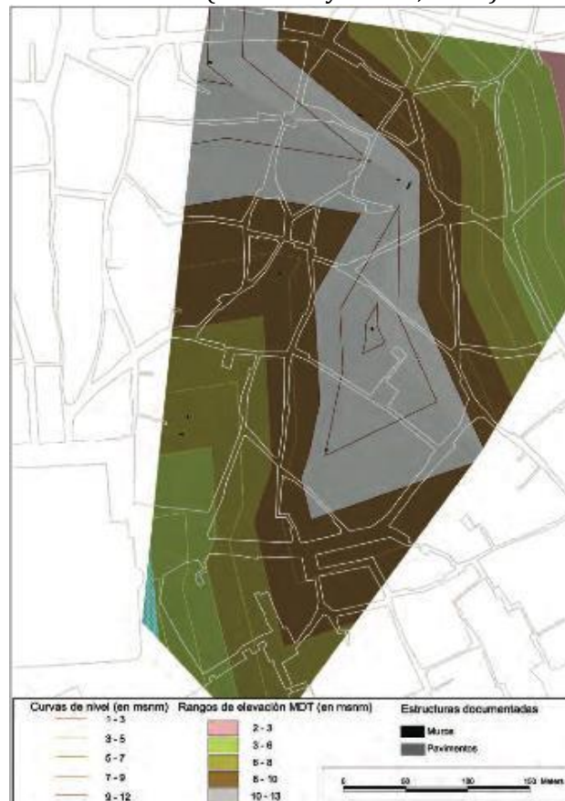
Figura 4. Modelo digital del terreno del tell protohistórico, según González Acuña, con los restos constructivos de este época documentados en las diferentes intervenciones arqueológicas realizadas (Escacena Carrasco y García Fernández 2012: 791).

constructivas suelen mantener la misma orientación a lo largo del tiempo, que en el sector occidental de la ciudad es norte-sur/este-oeste (Figura 4) mientras en la zona oriental, de mayor altura, las construcciones se adaptan a una topografía en terrazas y tienen una orientación suroeste-noreste (Escacena y García, 2012).