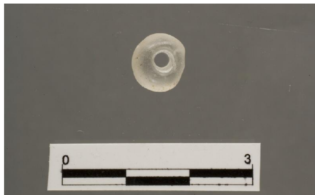
Figura 2. Cuenta de collar de cristal de roca de la tumba 111 de Fuente Álamo (Cuevas de Almanzora, Almería).

Durante el II milenio ANE volvemos a contar con varios ejemplares, asimismo excepcionales en cuanto a rareza, de cuentas de collar elaboradas sobre cristal de roca, si bien localizadas esta vez en el sureste, en el ámbito argárico, al que habría que añadir una cuenta esférica de cuarzo lechoso del enterramiento 1 de Lomas del Alcázar (Úbeda, Jaén) (Ruiz Fuentes et al. , 1998: 304). Siret describe en las tumbas 55, 292, 454 y 636 de El Argar una cuenta “de piedra blanca transparente” en cada una respectivamente (Siret y Siret, 1890). Aunque son coherentes con la tendencia observada, permanece la duda de considerar dicha descripción cristal de roca o un cuarzo blanco translúcido, como ha sido señalado (Costa Caramé et al. , 2011: 263), por lo que sólo incluimos en nuestro inventario la cuenta de la tumba 454 por tener un paralelo sólido en la sepultura 111 de Fuente Álamo, en la cual también hay algunas cuentas más de cuarzo (Pozo et al. , 2002; Schubart et al. , 2006).