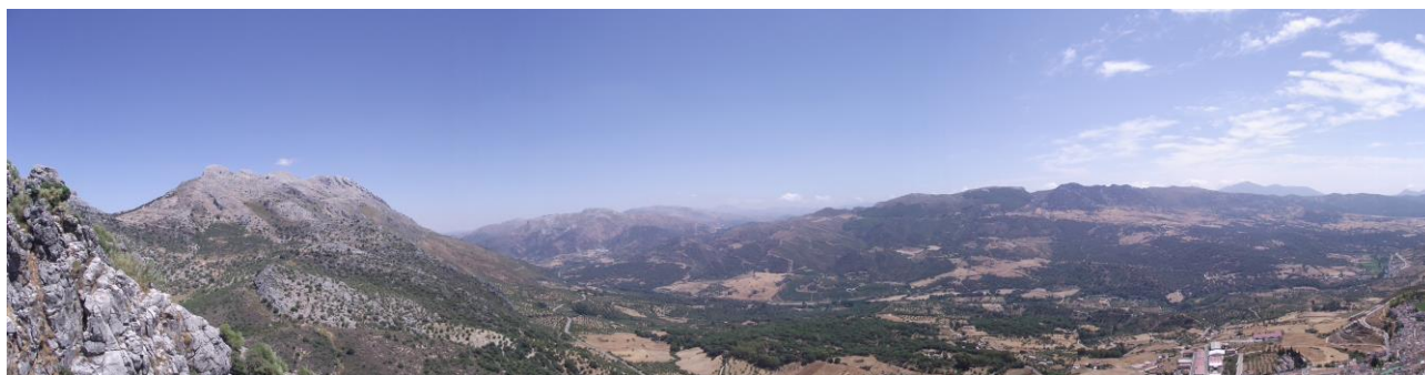
Figura 1. Panorámica del Valle del río Guadiaro

Como ya se ha mencionado, el Pleistoceno Medio-Superior viene caracterizado por las depresiones del Bajo Guadalquivir y del río Guadalete. En el Bajo Guadalquivir, las primeras evidencias de Pleistoceno Medio-Superior se documentan en las denominadas "terrazas altas" y "terrazas medias", formadas estas por un total de 7 terrazas (T5, T6, T7, T8 y T9, T10 y T11). De manera consecutiva a estas terrazas y enmarcada también en el complejo de "terrazas medias" aparece T12 como una terraza de transición hacia formas ya del Paleolítico Medio (presentes en T13). Para las "terrazas altas", se baraja una cronología de entre 780.000-300.000, evidenciándose una industria achelense clara pero escasa para los niveles T5 y T6 frente a la abundancia lítica de T7 a T9, destacando aquí la macroindustria sobre sílex. Por su parte, las "terrazas medias" de cronologías 300.000-80.000 y en especial T10 y T11 son la eclosión del achelense en el aspecto tecno-cultural. Secuencialmente, la terraza T12 supone como ya hemos comentado una fase de transición hacia las formas del Paleolítico Medio, presentando una perduración de las industrias en niveles anteriores (Vallespí, 1992: 67-69).