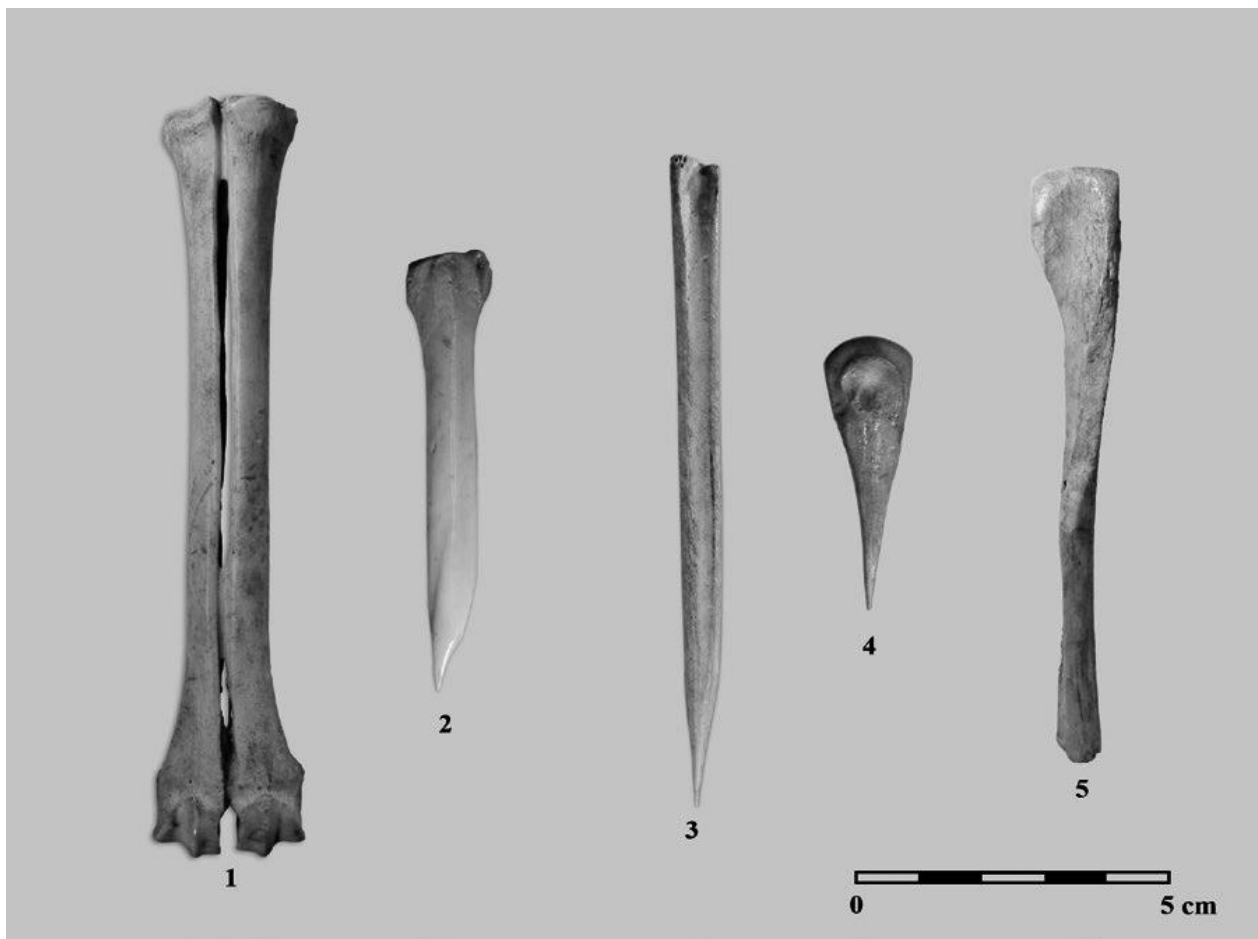
Figura 1. Instrumentos óseos asociados al Neolítico antiguo (Fase IV) de la cueva de El Toro: 1) TCT-85-46262; 2) TCT-77-8517; 3) TCT-85-46648; 4) TCT-80-22049; 5) TCT-80-22051.

Las ocupaciones más relevantes de El Toro durante el Neolítico están asociadas a dos períodos bien diferenciados: El Neolítico antiguo (5210-4950 2\sigma cal. A.C.) y el Neolítico final (4250-3950 2\sigma cal. A.C.) (Camalich y Martín-Socas, 2013; Égüez et al. , 2014) En ambos, ha sido posible documentar diferencias en los usos y funciones de la cueva, así como en las actividades económico-productivas realizadas durante su habitación, desde la alfarería y la industria ósea a las producciones líticas talladas y pulimentadas (Camalich y Martín-Socas, 2013).