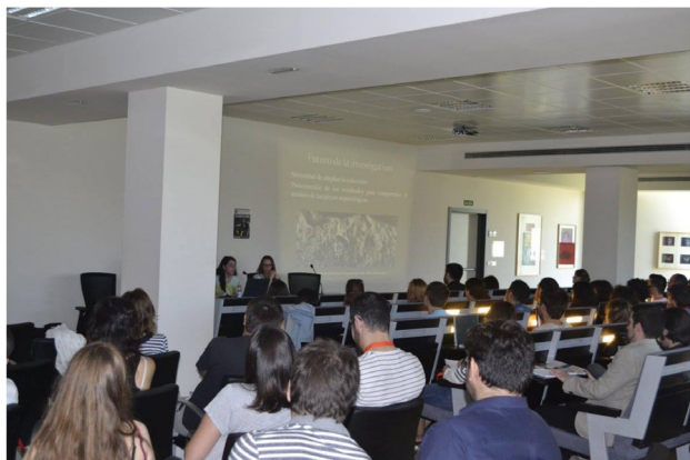
Sesión de Arqueología Experimental

ladas a la Arqueología de la muerte y a la subsistencia y el medio ambiente durante el Paleolítico.