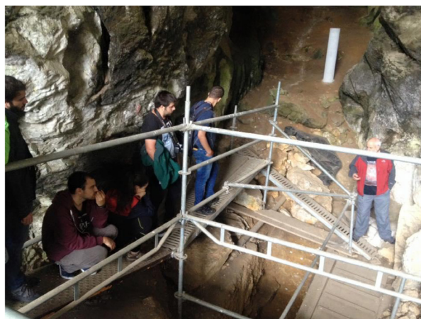
Visita a la Cueva del Mirón (Ramales de la Victoria, Cantabria)

En el cuarto y último día de las jornadas se llevó a cabo una salida de campo, que permitió a 70 participantes disfrutar del arte prehistórico de la región cantábrica. Concretamente, se visitaron las cuevas situadas en la localidad de Ramales de la Victoria (Cantabria), como son Cullalvera, El Haza, La Luz, Covalanas y El Mirón, cuyo estudio ha arrojado una información vital para la comprensión de los modos de vida de las sociedades humanas en la Prehistoria de la región cantábrica.