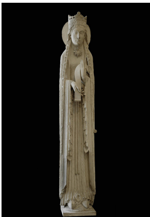
Figura 7. Representación de la reina de Saba ubicada en la fachada de Notre Dame de Corbell, Essone (Francia), Último cuarto del siglo XII.

paganas de la Yāhiliyya , revestidas de magia, que penetran en el Islam y que vienen a significar una suerte de sincretismo de la religión musulmana con las religiones mediterráneas que desde la Antigüedad vienen desarrollándose.