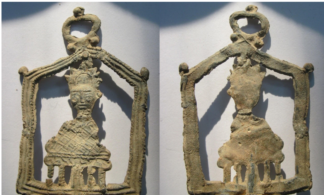
Figura 5. Amuleto (Gaspariño, nº 274).