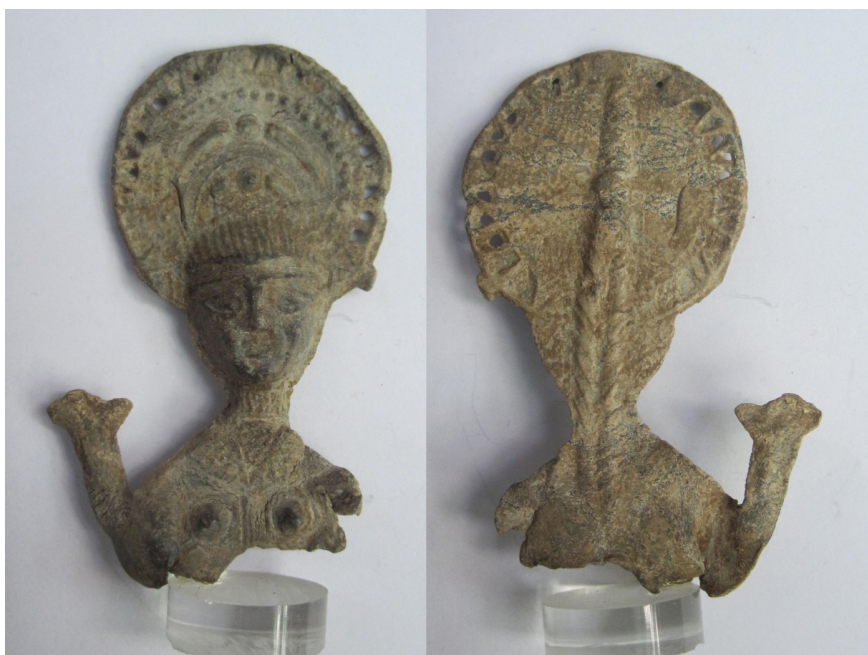
Figura 6. Amuleto (Gaspariño, nº 256)