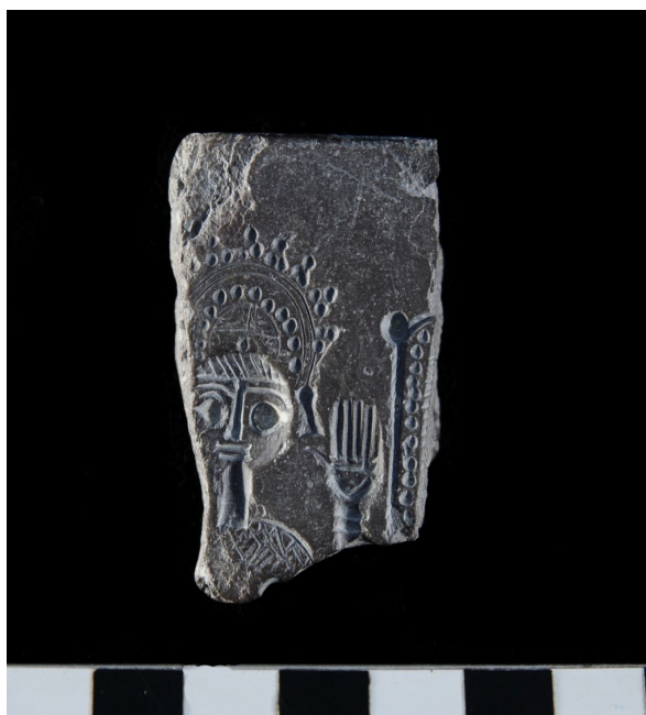
Figura 1. Cara A del amuleto de Jerez.

En algún momento, Gaspariño (nº 260) acierta a relacionar estas piezas con “Tanit” por estar su iconografía en una clara conexión formal con las representaciones de tradición fenicia de la llamada “Diosa Madre” y, en particular, con la idea de la diosa Astarté-Tanit. En esa idea había insistido anteriormente S. Fontenla Ballesta (2009). En el caso que nos ocupa, contamos con el privilegio de conocer a la perfección el resultado de ese trabajo con el plomo con lo cual cabe especular con la posibilidad de que se puedan encontrar piezas de plomo que hayan sido facturadas en este mismo molde. En cualquier caso, las similitudes con otros ejem-