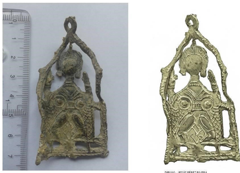
Figura 3. Amuleto de Ceuta (Fotografía J. M. Pérez Rivera).

aparezcan juntas la diosa y la vaca. Otros animales asociados a la diosa luna son la liebre, la paloma y las serpientes.