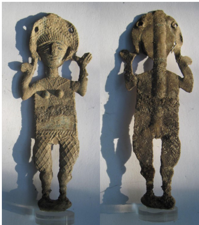
Figura 8. Amuleto (Gaspariño, nº 258).

Una última cuestión respecto al molde recuperado en Jerez,-y, en general, sobre estas figuras de carácter antropomórfico-, es la referida a su funcionalidad. De manera tradicional se las integró en la amplia familia de los amuletos medievales. El amuleto, tal y como explica el Prof. Álvarez de Morales, es cualquier objeto natural al que se le atribuyen poderes sobrenaturales y protege contra todo tipo de mal. En el mundo andalusí al amuleto se le llama ḥirz (refugio, asilo), nombre que ha dado lugar a herze , herze o alherze (Álvarez de Morales, 2011: 118).