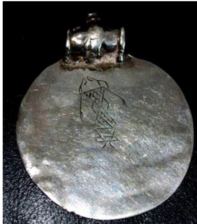
Figura 10. Amuleto con la imagen de Umm al-Subyān procedente de Omán (1850-1950), ( http://www.omanisilver.com/contents/en-us/d530.html ).