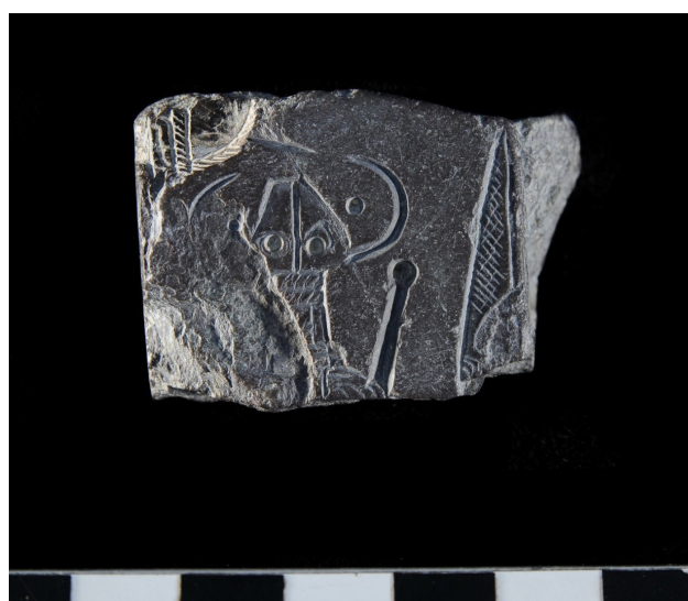
Figura 2. Cara B del amuleto de Jerez.