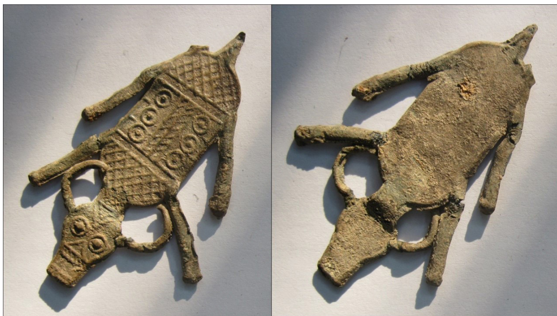
Figura 4. Representación figurativa en un talismán de una vaca (Gaspariño, nº 286)