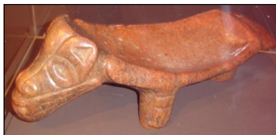
Figura 9. Dujo en mármol de Puerto Rico. Museo de Arte e Historia de la Universidad de Puerto Rico.

Española, Puerto Rico y las Bahamas, en menor representación en Cuba y Jamaica, estando casi ausentes en otras islas de población taína (Ostapkowicz 1997, Rodríguez Ramos 2007).