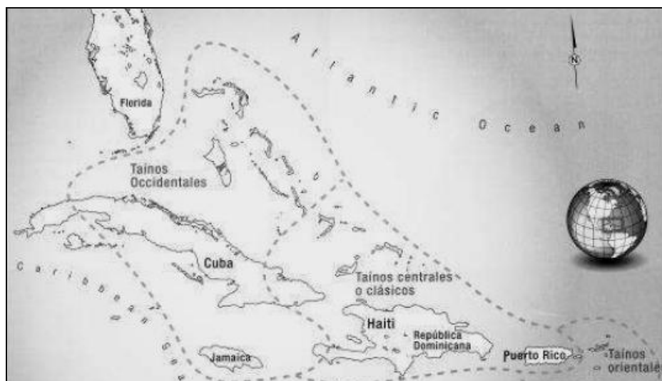
Figura 1. Distribución de las poblaciones taínas por el Caribe (Oliver et al. 2009).

Hueca] y AGRO-II [Igneri]] que a su vez se dividen en dos culturas: