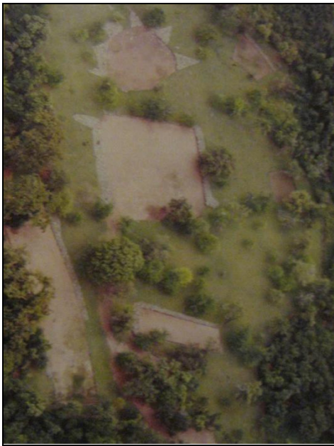
Figura 4. Vista aérea de la "Plaza Mayor" del Centro Ceremonial de Tibes ( Catálogo del Centro Ceremonial indígena de Tibes )

construcción representaba el inicio de una arquitectura pública, uniendo la fabricación de la identidad de la comunidad y el poder político (Fox 1996), siendo lugar también de comunicación entre el cacique y el pueblo (Lovén 1935). Conformaban el área donde se sustentaba la práctica ideológica a través de monumentos visibles y las ceremonias que en ellos se realizaban. Los bateyes en Puerto Rico se situaban generalmente próximos a los ríos y en los puntos más altos de las montañas, generalmente en lugares favorables a la producción agrícola, también a la caza y la recolección, en los márgenes de las tierras de cultivos, enfatizando una distinción entre el contexto doméstico y el no doméstico, como ocurría en la mayoría de las tumbas megalíticas europeas (ver Sjögren 2004).