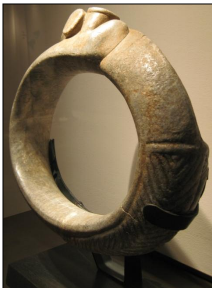
Figura 5. Aro lítico de Puerto Rico. Donado por M. Rupalley al “Musée d’ethnographie du Trocadéro” (1927) y depositado en el “Muséum national d’histoire naturelle-Musée de l’Homme”. Actualmente en el “Musée du quai Branly”, París (Francia).

usando toscas herramientas de piedra, sin que se les rompieran. Para algunos la técnica utilizada no tiene paralelo en ninguna otra cultura aborigen de América (Pons y Alegría 1987).