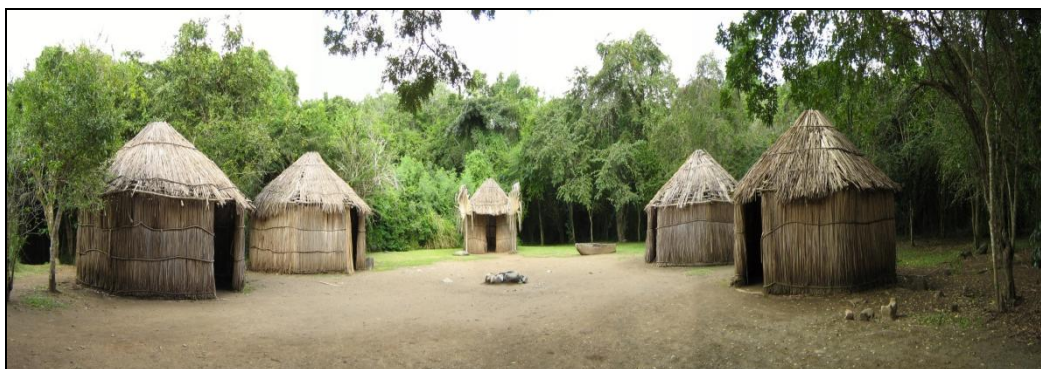
Figura 2. Recreación de yucayeques en el Centro Ceremonial de Tibes.

La población taína poseía una cultura de tipo neolítico, siendo desconocedores del arte de fundir metales, aunque recientemente se han analizado pequeños objetos metálicos, el guanín (aleación entre oro, cobre y plata), el turey (latón) y el caona (oro nativo) encontrados en enterramientos taínos del yacimiento El Chorro de Maíta en Cuba (Martínón et al. 2007). En cualquier caso en el periodo final de los taínos ocurre un cambio de sus costumbres, valores y estructuras sociales al interaccionar con los europeos.