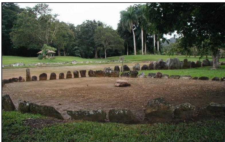
Figura 3. Parque Ceremonial de Caguana.

naban como un mecanismo para regular y canalizar ritualmente la competencia entre las elites, las cuales iban en demanda de expansión territorial o de mayor control de los recursos. El juego de pelota tendría la función de relajar la competencia entre elites, evitado que culminase en actos bélicos. Acoplada al concepto de centros ceremoniales ubicados en los bordes fronterizos, la función del batey como "amortiguador" o "válvula de escape" de presiones políticas y religiosas es evidente (Oliver 1998).