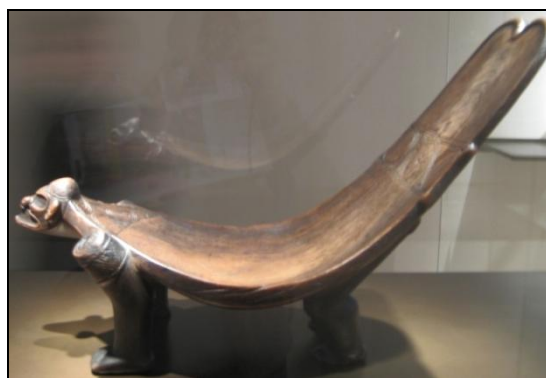
Figura 10. Dujo en madera de la República Dominicana. Actualmente en el “Musée du quai Branly”, París (Francia).