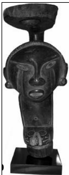
Figura 8. Ídolo antropomorfo (hombre-rana) con un platillo para la cohoba (guayacán). Carpenter Mountains, Jamaica. Museo Británico (Oliver 2007b)

pequeño banco de cuatro patas bajas (Figura 9). De isla en isla se diferenciaba el material utilizado en producción y su forma. El dujo ceremonial era de gran importancia para los taínos y era utilizados por los caciques, chamanes y visitantes distinguidos durante la ceremonia de la cohoba, en los areítos y juegos de pelota, y para enterrar en cuclillas sobre ellos, a los caciques.