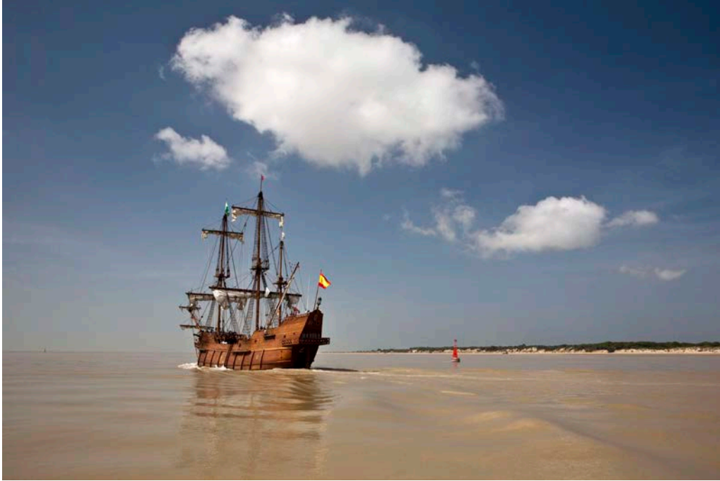
Fig. 1. Le galion Andalusia , réplique réalisée en 2010 d'un navire du XVII e siècle de la Carrera de Indias, s'apprête à sortir de l'embouchure du Guadalquivir et à franchir la barre de Sanlúcar (de Barrameda).