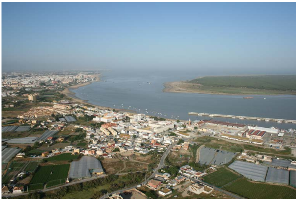
Fig. 3. Depuis la rive gauche, l'embouchure du Guadalquivir. On voit à droite, le petit port de pêche de Bonanza, devenu à partir du XVII e siècle le monillage des navires des flottes des Indes attendant de franchir la barre de Sanlúcar. Plus loin, sur la même rive, la ville de Sanlúcar de Barrameda dont les immenses modernes occupent une ancienne anse comblée depuis la fin du Moyen-Âge et la Punta del Espíritu Santo, fortement érodée depuis le XVI e siècle. À l'horizon, Chipiona. Sur la rive opposée, soumise à une forte dynamique sédimentaire, Punta de Malandar (mal-aller) avec la pinède de la Marismilla.