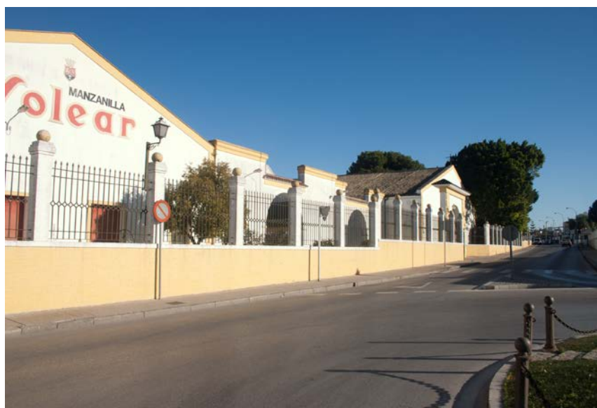
Fig. 2. Vista de las bodegas Barbadillo de Sanlúcar de Barrameda. La ciudad burguesa.