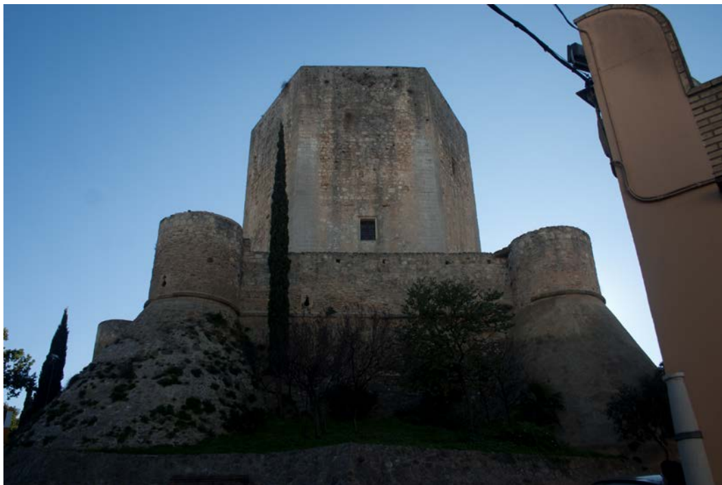
Fig. 1. Vista del castillo de Santiago de Sanlúcar de Barrameda. La ciudad defensiva.