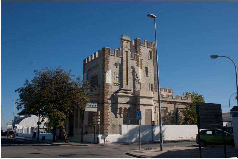
Fig. 3. Vista de un chalet de la Av. Bajo de Guía de Sanlúcar de Barrameda. La ciudad turística.