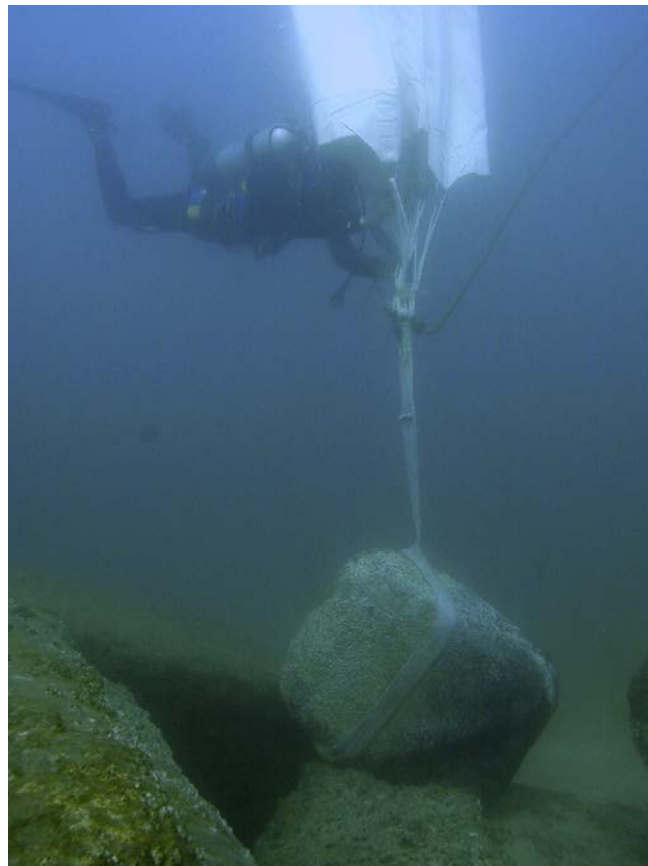
Fig. 3. Déplacement d'un bloc à l'aide d'un ballon.

Sur le site sous-marin de Qaitbay, une série d'applications ludiques s'appuyant sur le travail des plongeurs-archéologues pourrait être proposée afin d'appréhender les techniques et les méthodes utilisées dans le cadre de la fouille : comme le calcul du volume d'un ballon pour déplacer un bloc de granite sous l'eau (fig. 3).