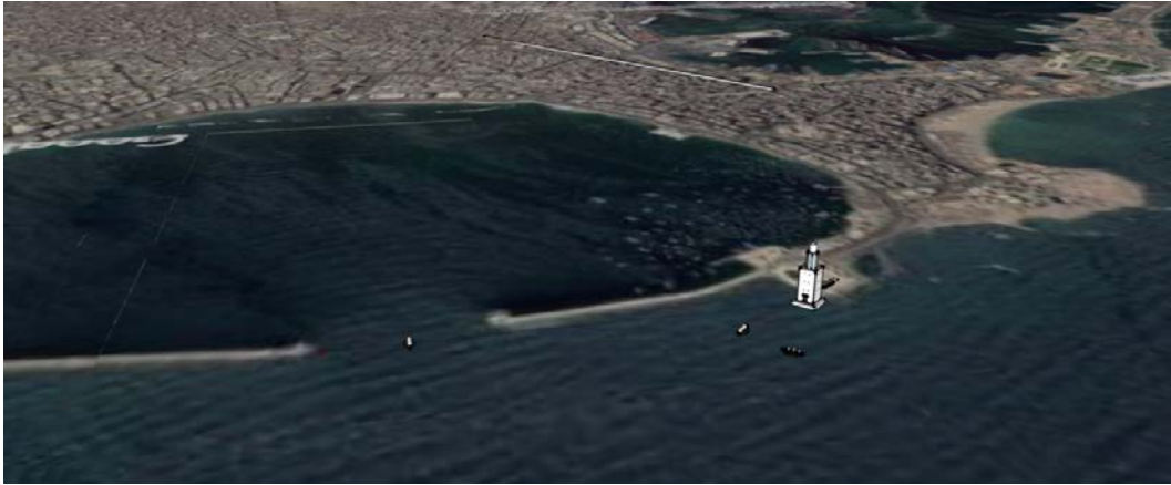
Fig. 5. Restitution du Phare d'Alexandrie avec insertion dans le site (3D I. HAIRY).

Avec l'utilisation de la photogrammétrie par corrélation d'images denses et de la 3D dans la recherche archéologique sur le site sous-marin de Qaitbay, de nouvelles pistes méthodologiques sont apparues, aussi bien dans les pratiques de terrain où les méthodes modernes se sont substituées aux méthodes traditionnelles, que dans les études consacrées au mobilier immergé. Ces nouveaux usages ont entraîné de profondes transformations dans les pratiques d'investigations : la manipulation de données dans un environnement tridimensionnel, la capacité de corriger la visualisation des surfaces des objets, la capacité de produire des restitutions scientifiques en 3D (fig. 5) peu figées et de représenter virtuellement les environnements disparus, etc. Ces nouveaux usages du numérique nous mèneront inexorablement à ouvrir de nouvelles portes vers les domaines de la valorisation et vers une approche participative de la recherche.