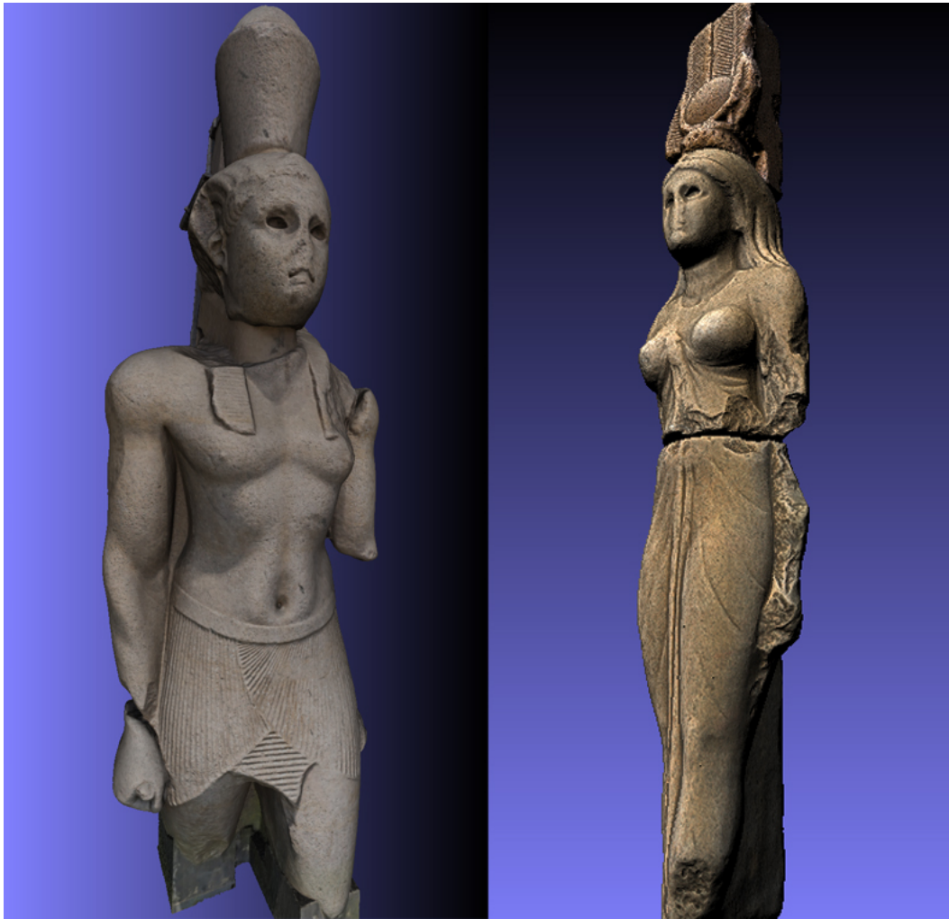
Fig. 2. Doubles numériques des statues colossales d'un roi grec en pharaon et d'une reine grecque en Isis (photogrammétrie M. ABD EL AZIZ, restitution virtuelle (Isis) et DAO I. HAIRY).

À travers cette rapide présentation, on aura saisi l'importance d'un tel site pour le patrimoine alexandrin et égyptien, puisque le Phare d'Alexandrie est au moins aussi réputé que les pyramides de Chéops et Kephren ! Mais il faut bien reconnaître que la difficulté d'accès au site sous-marin rend sa visibilité quasi nulle pour le grand public, si ce n'est au travers d'images, de photos publiées dans des revues grand public, et de documentaires qui deviennent vite obsolètes à mesure que le travail des archéologues avance.