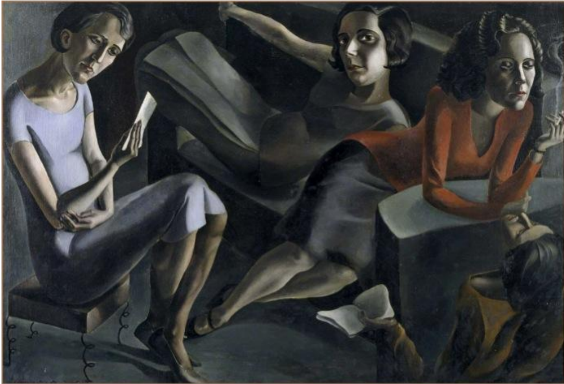
Imagen 1. Tertulia , 1929. Museo Nacional Centro de Arte Reina Sofía. Madrid

En esta pieza, la pintora se pinta a sí misma con el mismo peinado moderno que la mujeres de Tertulia –un estilo que en España se conocía como pelo «a lo chiquillo» o «a lo manolo»– ropas sueltas y mirada frontal. En una primera impresión, parece que la retratada mirara atentamente a alguien o algo ubicado fuera del espacio pictórico, al espectador del cuadro, por ejemplo. Sin embargo, al observar detenidamente su gesto, adivinamos que no es así. Su rostro recoge un momento de ensimismamiento, de concentración o de pensamiento. El autorretrato no persigue solo la captación de la apariencia física (un físico que ya de por sí resulta elocuente) sino que procura congelar la mirada de la pintora en un momento de reflexión, de ejercicio intelectual o de cálculo. De este modo, el autorretrato se convierte en un iniciativa reivindicativa que va en consonancia con las protestas de muchas intelectuales contemporáneas, pues al captar una mirada inteligente y reflexiva esta pintura incidía, como la de sus colegas, en el derecho de las mujeres modernas a luchar por el reconocimiento de su intelectualidad y su capacidades creativas, dignas de ocupar un lugar de mérito, como escritora, artista o filósofa, en la vanguardia española.