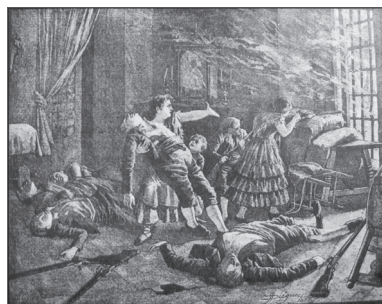
Quema de Montellano y asalto a Algodonales: dos ejemplos de la barbarie francesa.

configurará un nuevo futuro. Desde Cádiz y la Isla se dirigió la defensa de la patria, se organizaron los ejércitos y se formaron alianzas. Desde ese rincón andaluz, se pergeñó la independencia de la patria al tiempo que el emperador Napoleón empezaba a paladear las hieles de la derrota.