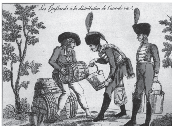
Suministro de aguardiente a soldados franceses

¡Y los dineros! La necesidad de dinero y de comida que en ambos bandos enfrentados durante la guerra de la Independencia, al igual que en cualquier otra guerra y en todas las guerras habidas y en las que, por desgracia, habrá, se suscitó durante toda la contienda. La teoría de Napoleón era que sus ejércitos se alimentaran de los productos del país que ocuparan y esa teoría fue llevada a la práctica con todas sus consecuencias durante la ocupación de la Península Ibérica. Pero los hombres huyeron de los franceses, se alistaron en los ejércitos o se sumaron a las guerrillas, de manera que los campos quedaron desasistidos de mano de obra. Además, los campesinos, que a su vez eran exprimidos por el ejército invasor, no tenían interés en trabajar para que luego les fuera usurpada la cosecha. Los pueblos de toda Andalucía y de toda España quedaron a merced del hambre y de la miseria. La economía del país se vino abajo y muchos pueblos, otrora florecientes, quedaron faltos de hombres que faenaran y produjeran tanto en los campos como en las fábricas o el comercio. Sólo las provincias americanas mantenían la mínima subsistencia a aquellas ciudades donde sus barcos conseguían llegar, poniendo especial énfasis en Cádiz, donde se resguardaba el gobierno, las autoridades y las Cortes.