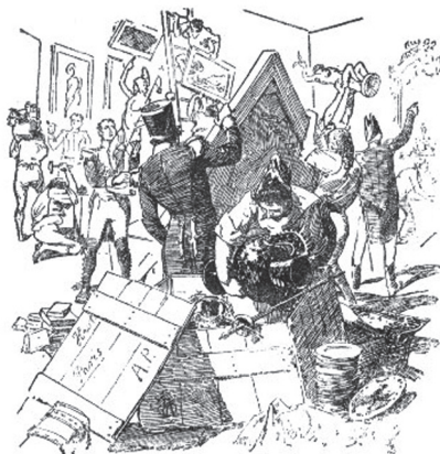
En la huida quisieron llevarse España en carretas.

Pero el verdadero equipaje no fueron tanto los tesoros y obras de arte, sino los hombres y mujeres que se marcharon con ellos, los extrañamientos, el exilio para una parte importante de la intelectualidad española. En apreciación del embajador Laval, entre los refugiados en Francia se hallaban grandes propietarios, hombres de talento, y aquellos que gobernaban España en 1808 31 . Más de 12.000 exiliados se calcula que entraron en Francia en el verano de 1813, la mayoría, cabezas de familia, según calcula Luis Barbastro, acompañados muchos de sus mujeres, hijos y algún criado en el caso de personas acomodadas 32 . Tras ellos quedaron vidas segadas por la guadaña de la guerra, honores vejados, haciendas holladas y miles de cadáveres en los campos de batalla y en los caminos de la venganza.