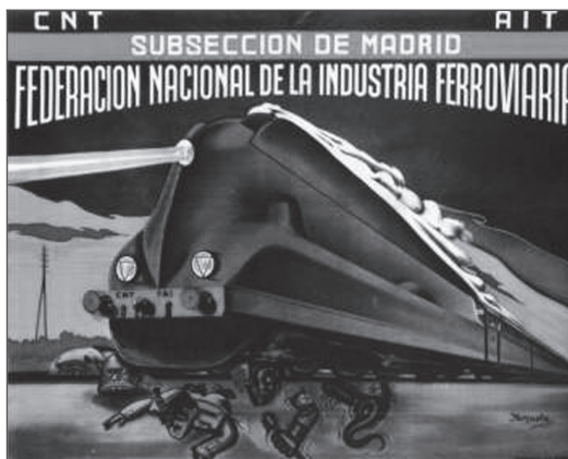
Ilustración 3. Iturzaeta. Federación Nacional de la Industria Ferroviaria (CNT-AIT).

El tren ha sido elemento fundamental en el progreso económico, industrial y social de los pueblos, convirtiéndose, en el símbolo del mismo progreso. El hecho de discurrir sobre raíles de hierro, que le imposibilitan para variar su discurrir, y su propia naturaleza férrea, unido a la idea de velocidad que genera su visión, hacen de este medio de transporte un símbolo revolucionario, tal como se constata en alguno de los carteles de la Guerra Civil (Ilustración 3).