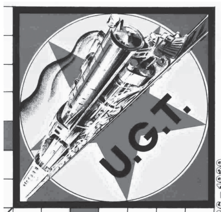
Ilustración 7. U.G.T.

Esta mención al sindicato socialista de la U.G.T. se hace precisa por la pertenencia a este sindicato del presidente del gobierno, D. Francisco Largo Caballero.