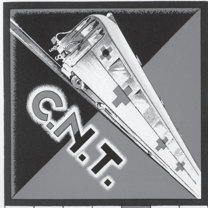
Ilustración 4. C.N.T.

Tomando como punto de referencia el escudo central, y situando éste de pie, la figura ubicada abajo a la izquierda, que en teoría es por donde se ha de comenzar la numeración, aunque esta no exista, se corresponde con las siglas de la C.N.T. Esta casa, en el parchís cotidiano se corresponde con el color amarillo.