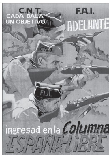
Ilustración 9. Iturzaeta. Ingresad en la Columna España-Libre.

Es evidente que el mensaje ideológico que expresa el tablero, es obra de la dirección del sindicato anarquista, pero corresponde a Iturzaeta, caso de que sea este el autor, el mérito del programa iconográfico. Este, se halla limitado, voluntariamente a la imagen aparentemente fría e inexpressiva del tren, al cual ha de dotar de un sutil contenido semántico. No es fácil, tomando como único elemento iconográfico una máquina, saber dotarla de vida propia, expresividad, ideología, e incluso sexo. Sin embargo, se consigue un complejo mensaje ideológico muy superior que si se hubieran utilizado distintas imágenes para los diferentes partidos políticos. Se trata de las variadas visiones de un mismo hecho.