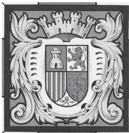
Ilustración 8. Escudo de la República

En este sentido, y enlazando con la figura del escudo, hay que hacer hincapié, igualmente en la bandera tricolor. La franja morada que se le añade a las tradicionales roja y amarilla, con el fin de diferenciarla de la del régimen que se ha abolido, se hace oficial en el decreto de 27 de abril de 1931, y es refrendada con la elevación a artículo, en la Constitución Republicana de 9 de diciembre de ese mismo año. En dicho artículo se aclara la inclusión de dicho color castellano, junto a los catalana-aragoneses: