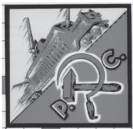
Ilustración 5. Partido Comunista.

Bajo el tren, la hoz y el martillo, símbolos del comunismo, flanqueados por las letras P.C. Llama la atención que tanto el tren, como los símbolos y siglas comunistas estén realizadas en color azul, máxime teniendo en cuenta el momento histórico en que se encuentra, con una contienda armada en la que el color azul tiene unas claras connotaciones negativas.