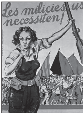
Ilustración 1. Arteché. Les milicies us necessiten!

triunfan las fuerzas conservadoras sublevadas. La mujer es llamada a la lucha, tanto armada como a la retaguardia, ofreciéndoles un papel, hasta ahora desconocido, al lado de los hombres.