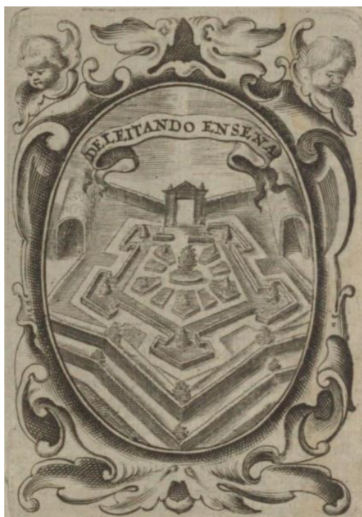
Saavedra Fajardo: Idea de un príncipe político cristiano representada en cien empresas

ingeniería militar 15 . Es comprensible, que un monarca “guerrero”, como fue Felipe V, tratase de educar a sus hijos en dichas cuestiones de gran importancia para un futuro rey.