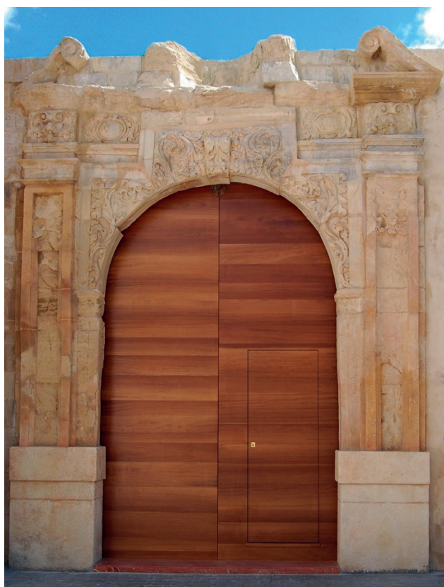
Imagen 2 Portada de la iglesia conventual en la actualidad.

Se calcula que la iglesia contaba con un aforo suficiente para 400 fieles, con una superficie construida ligeramente inferior a la mitad de la que tiene la parroquia 60 . La planta seguía